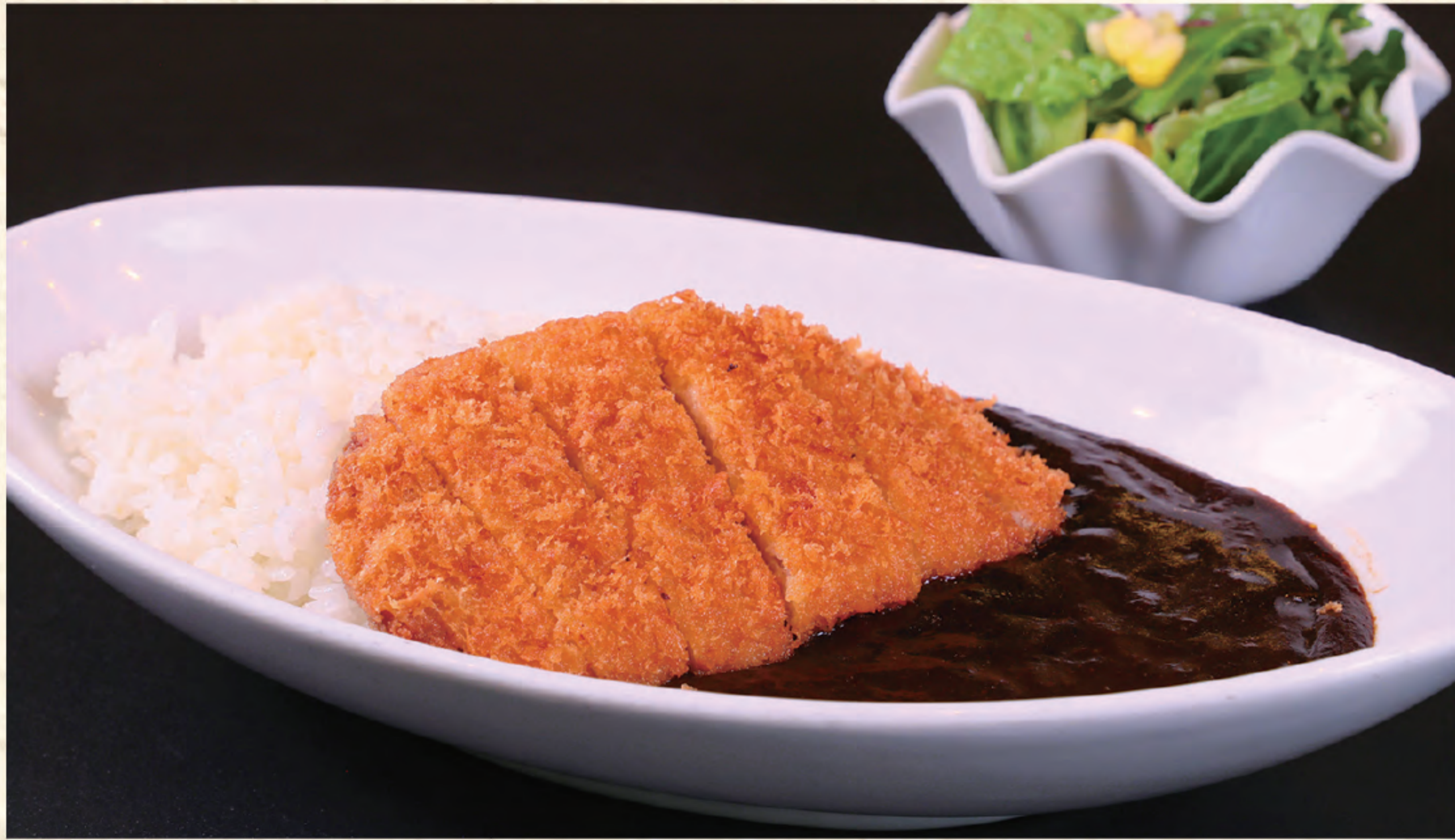
カツカレー 1,300円(税込)