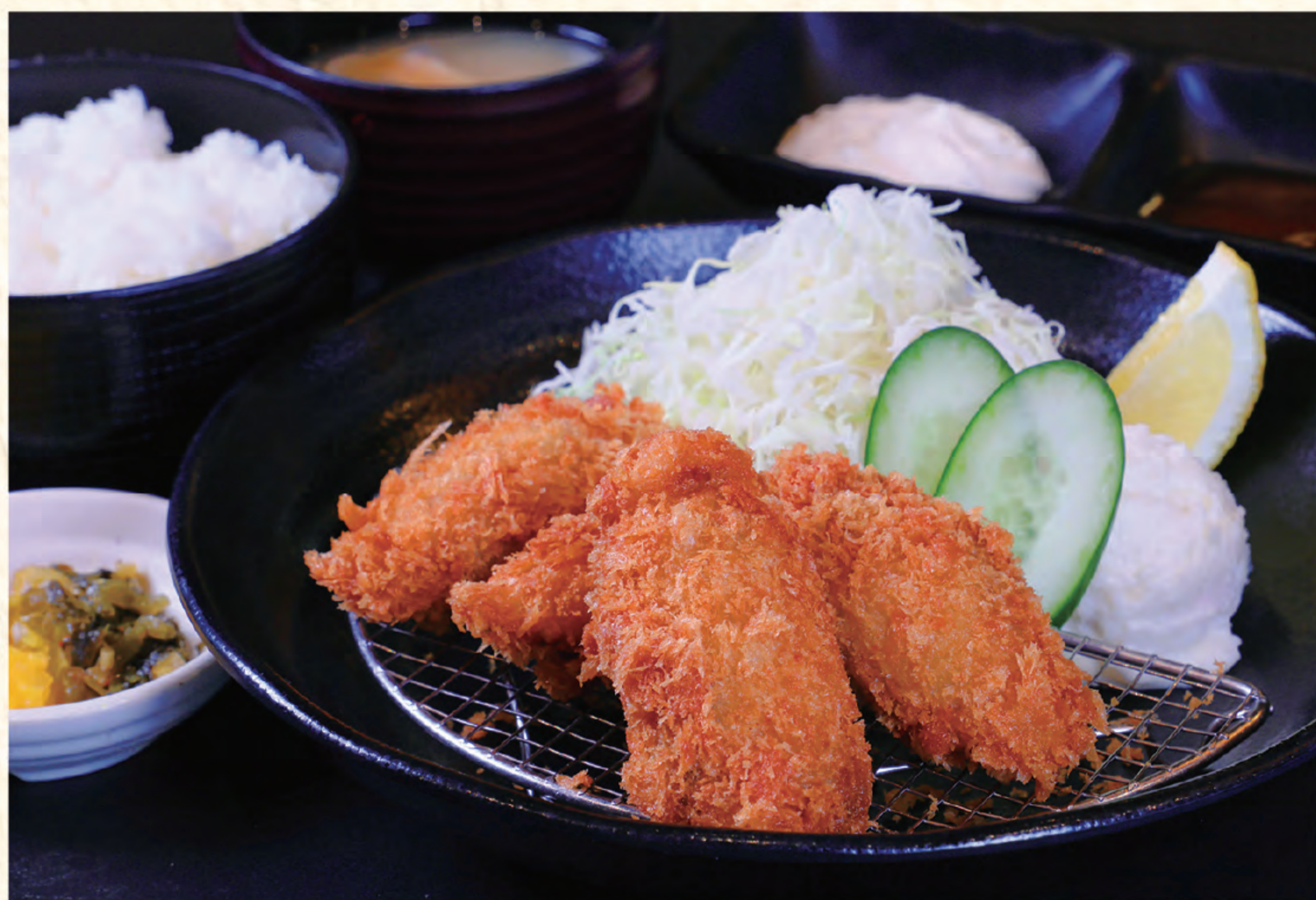
カキフライ定食 1,500円(税込)