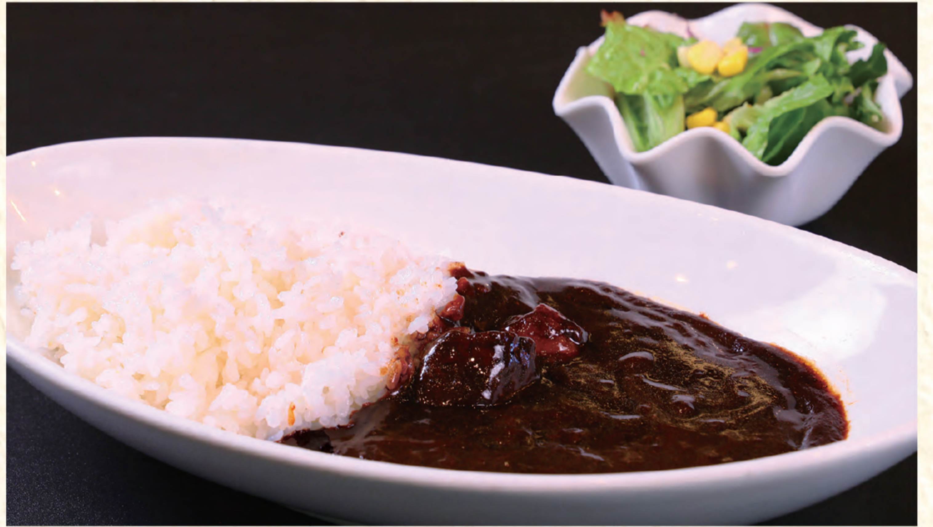
5時間じっくり煮込んだ濃厚ビーフカレー 1,000円(税込)