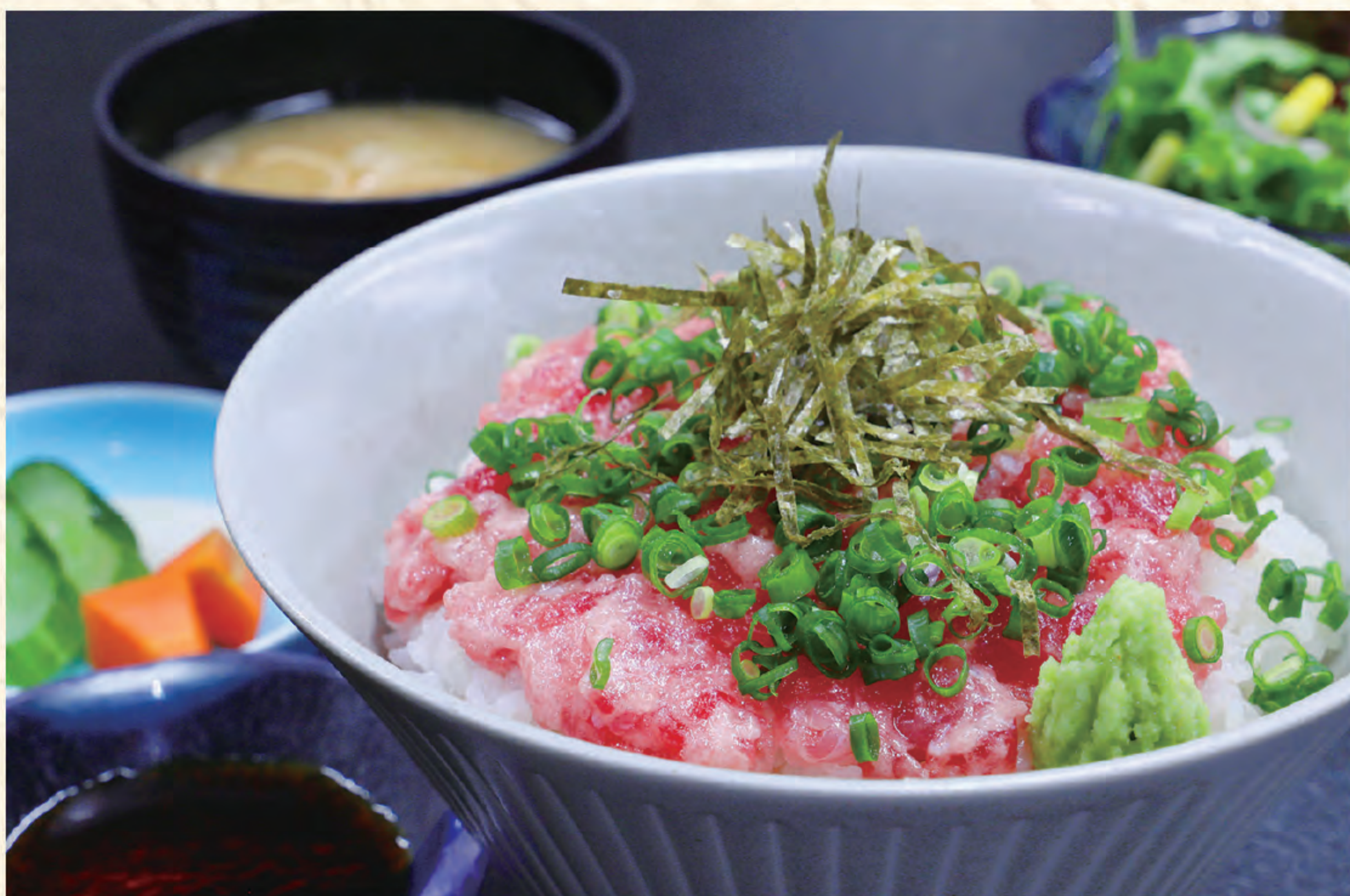
ネギトロ丼 1,300円(税込)