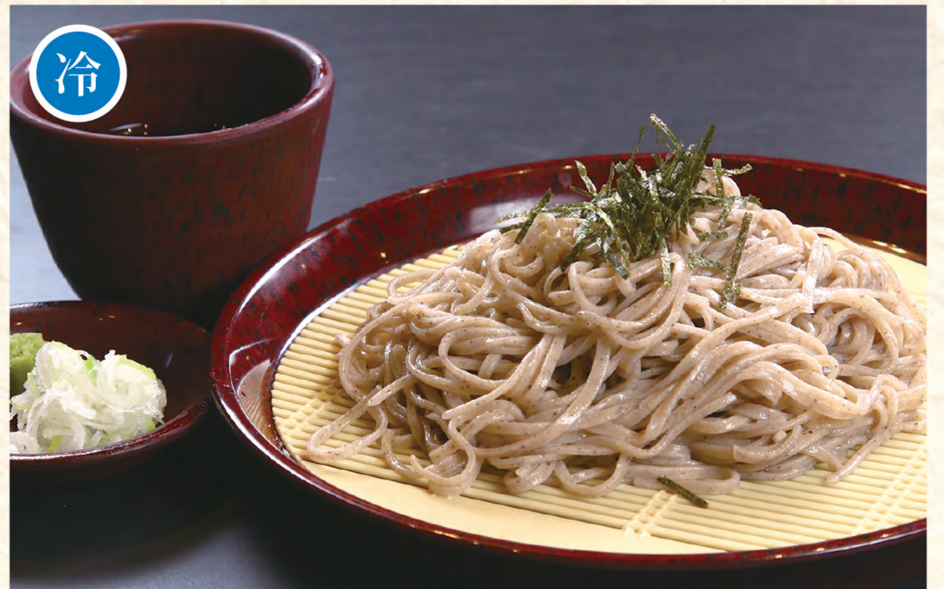
そば 800円 (税込)