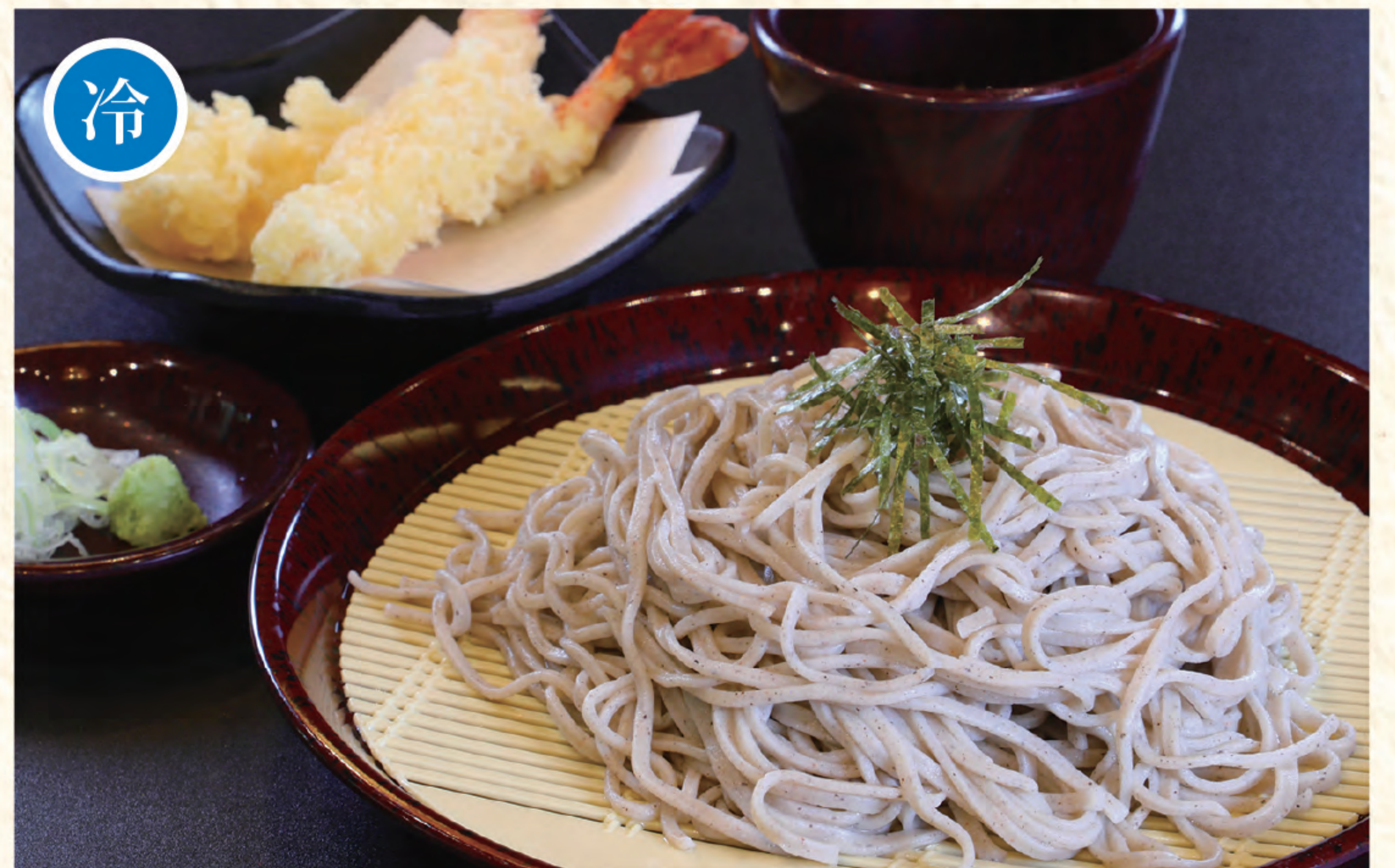
天婦羅そば 1,200円 (税込)