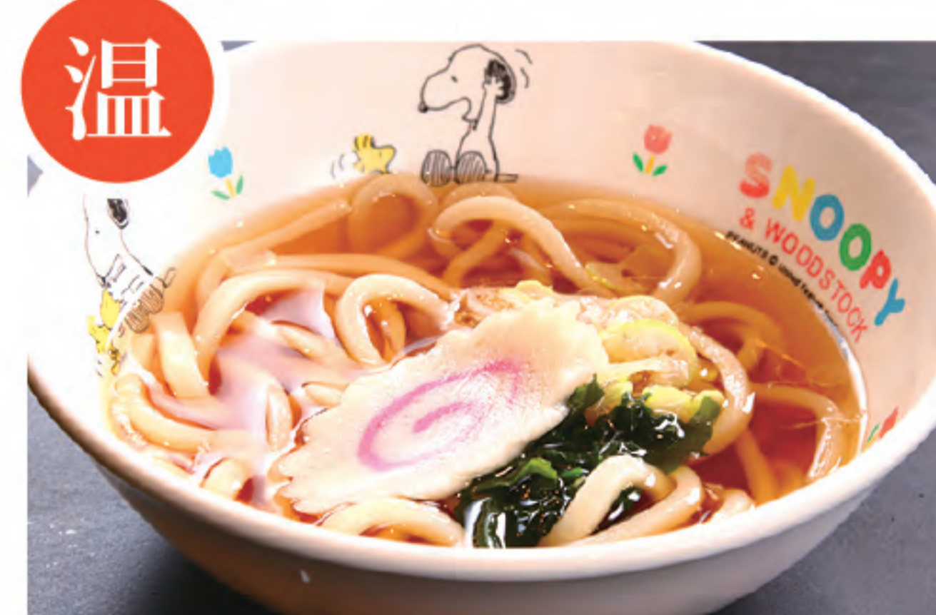
お子さまうどん (0.5玉) 350円 (税込)