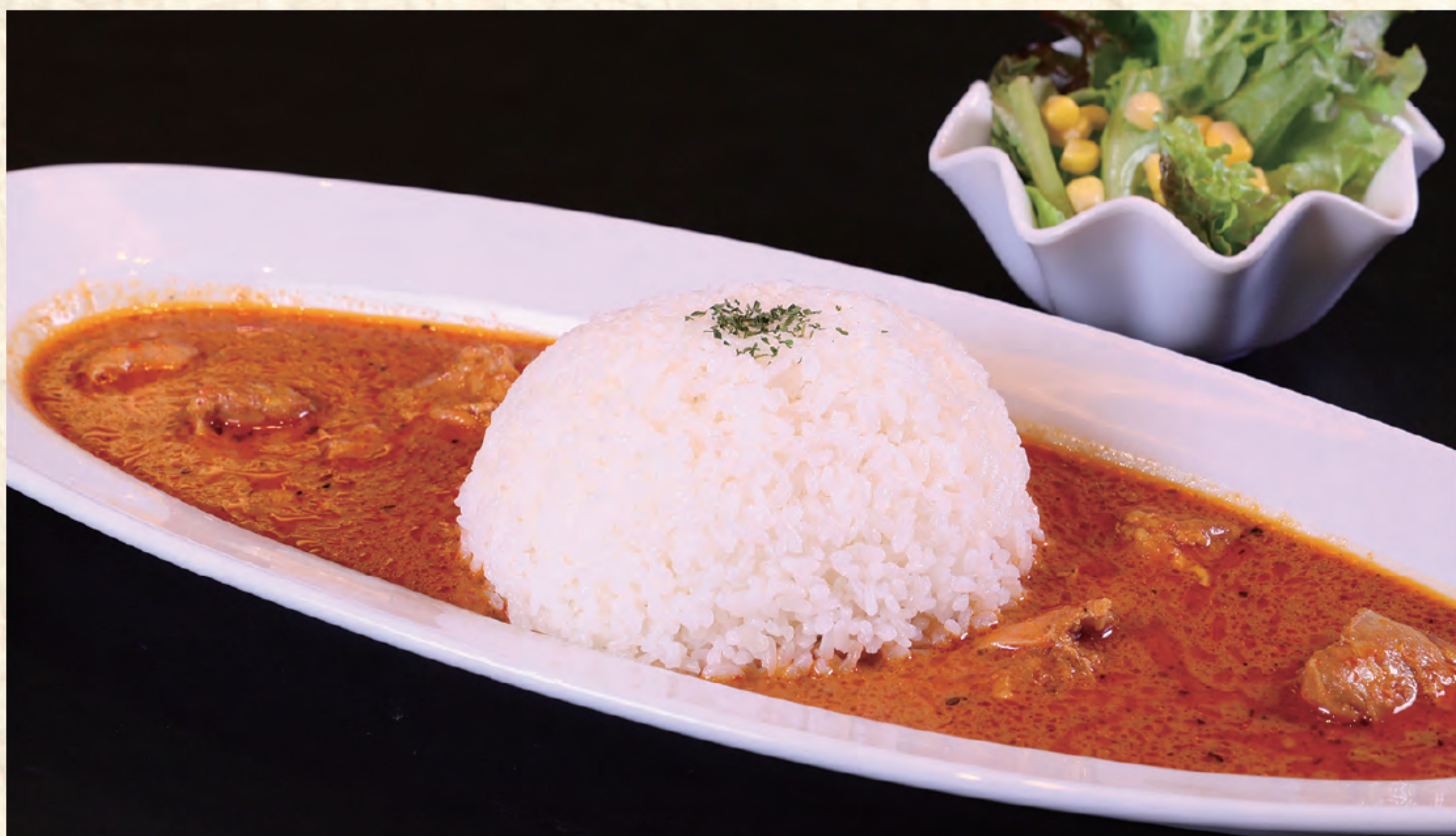
マレーシア風チキンカレー 1,000円(税込)