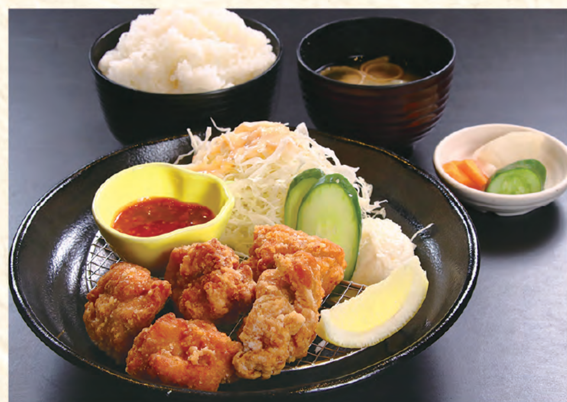
唐揚げ定食 1,300円(税込)