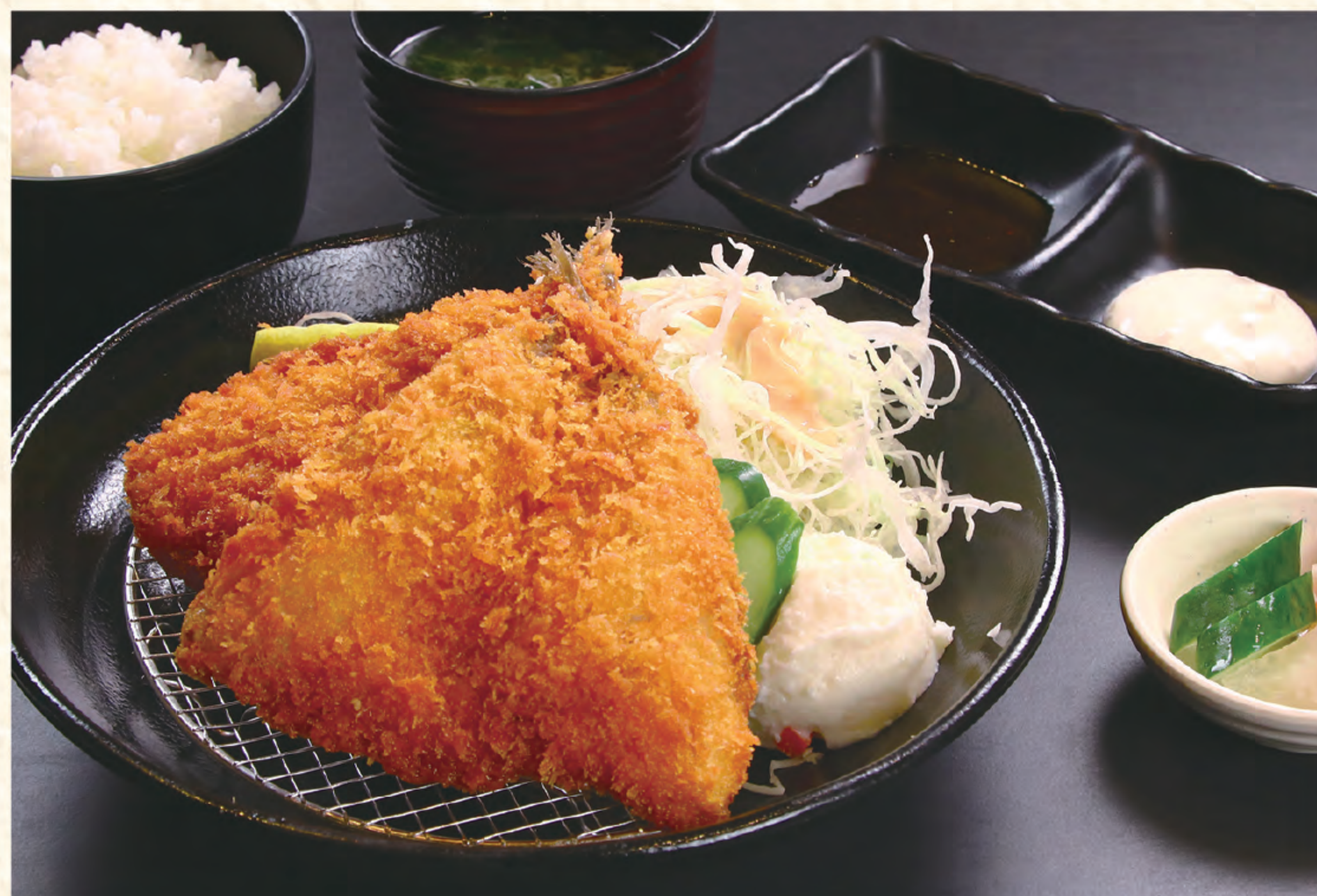
アジフライ定食 1,000円(税込)