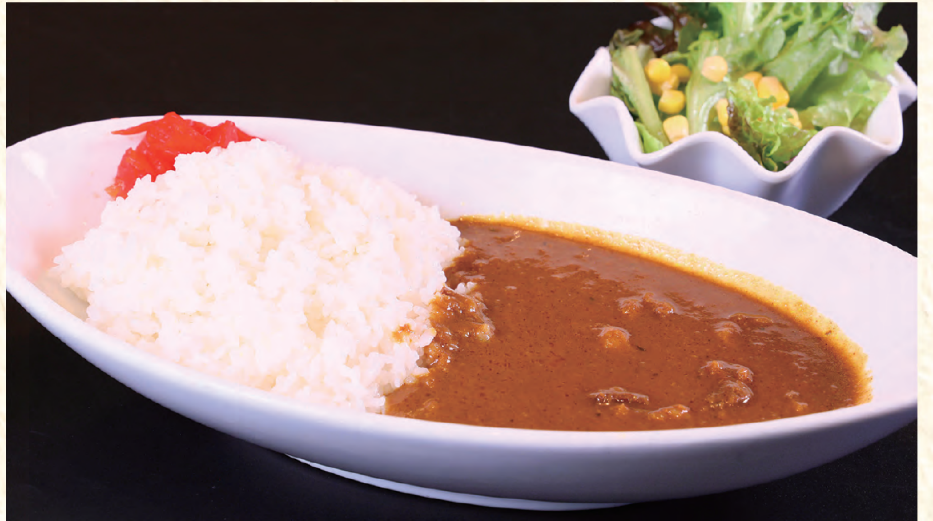
欧風ビーフカレー 1,000円(税込)