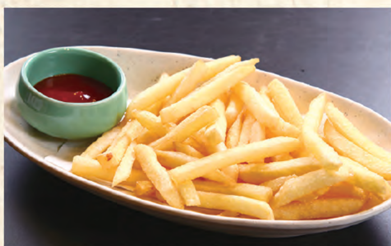
フライドポテト 400円(税込)