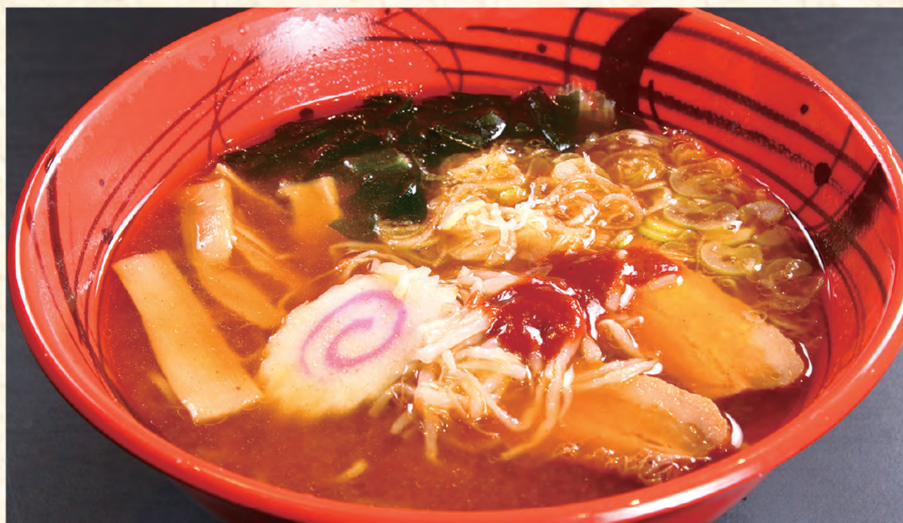
うま辛ラーメン 900円(税込)