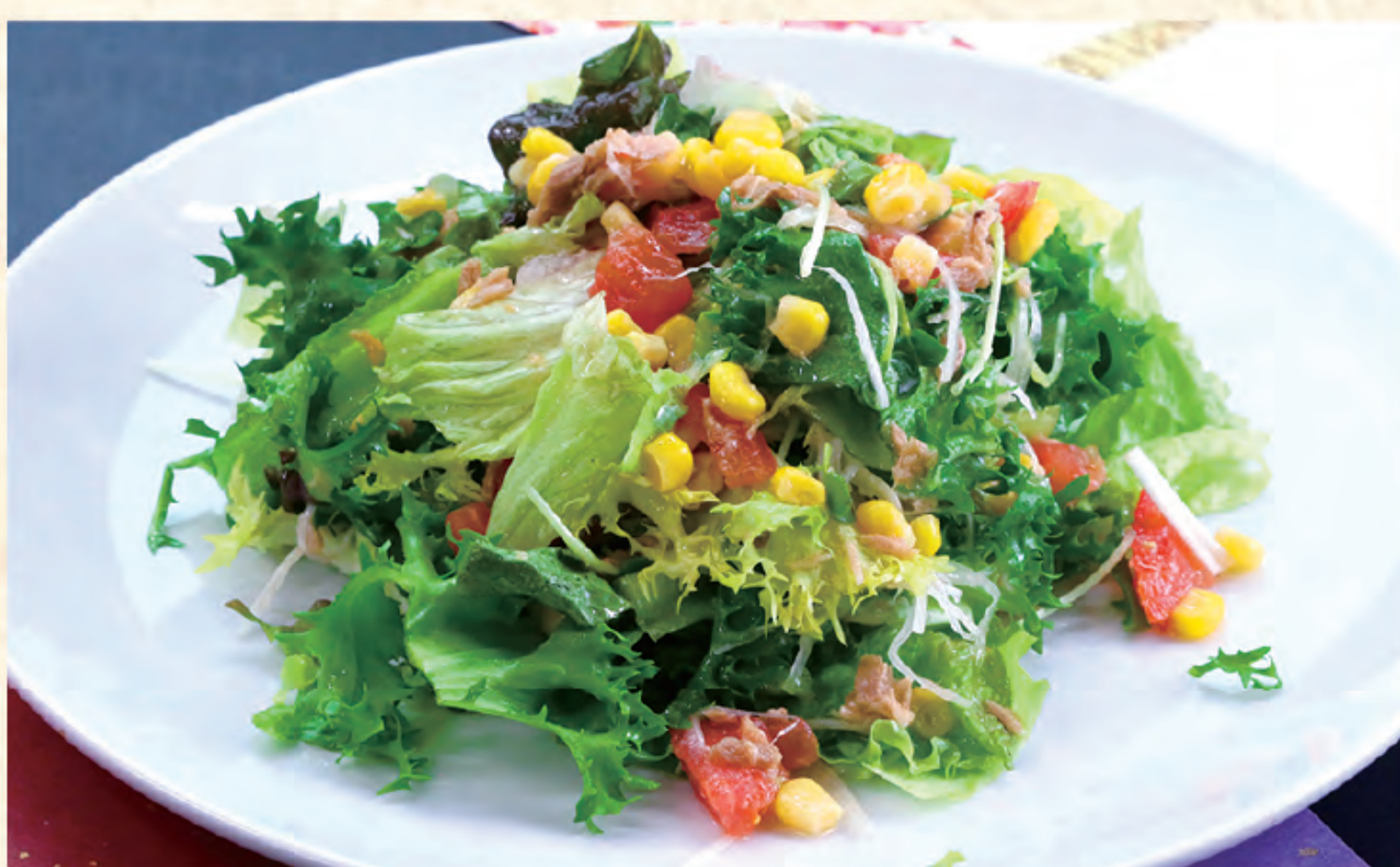
グリーンサラダ 600円(税込)