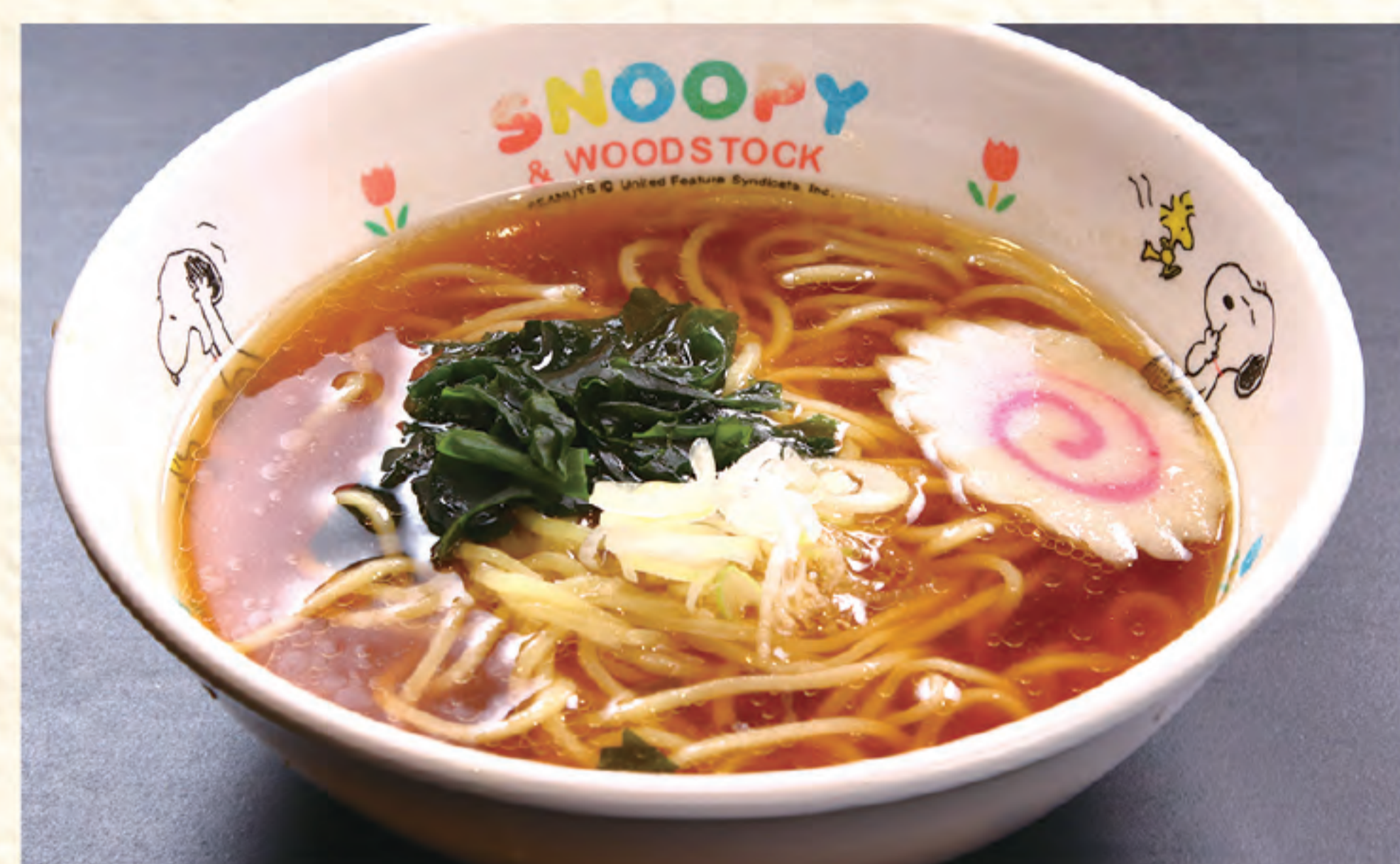
お子さまラーメン(0.5玉) 450円(税込)