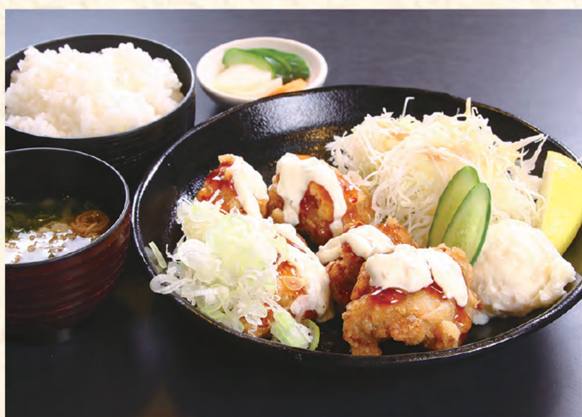
チキン南蛮定食 1,300円(税込)