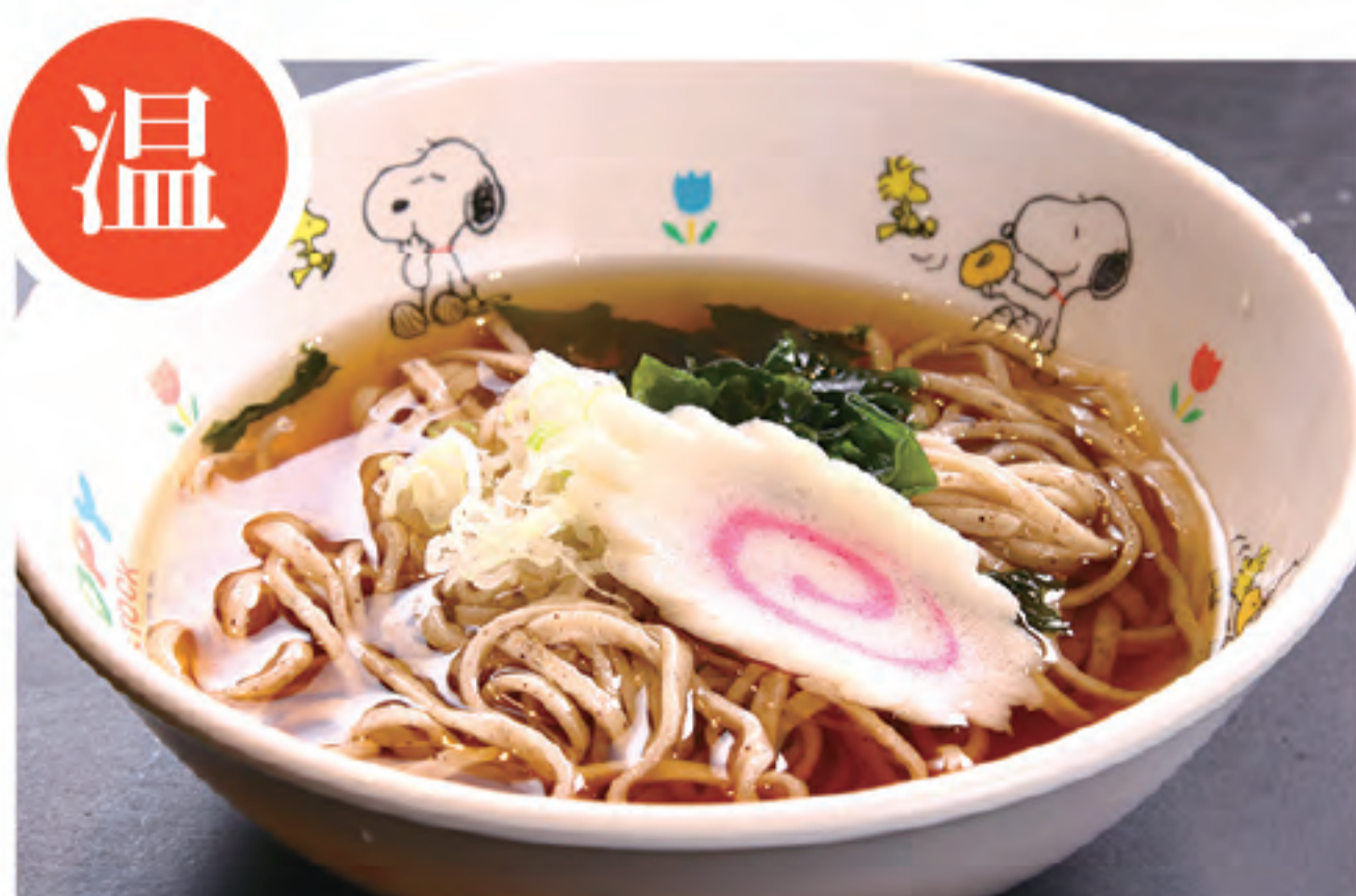
お子さまそば (0.5玉) 350円 (税込)