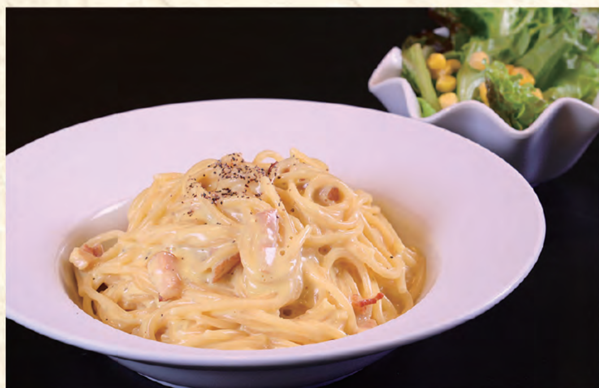
カルボナーラ 1,000円(税込)