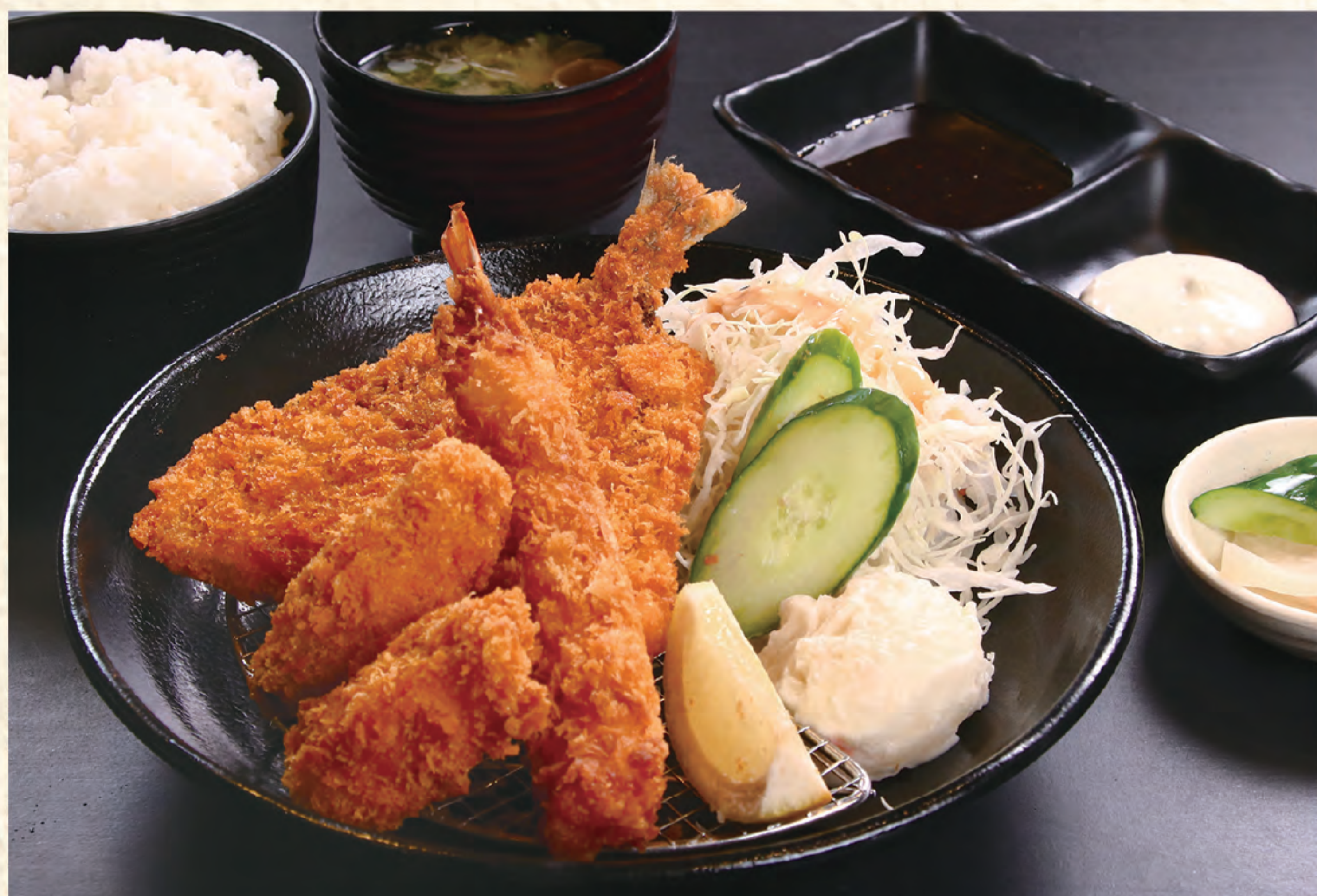
ミックスフライ定食 1,500円(税込)