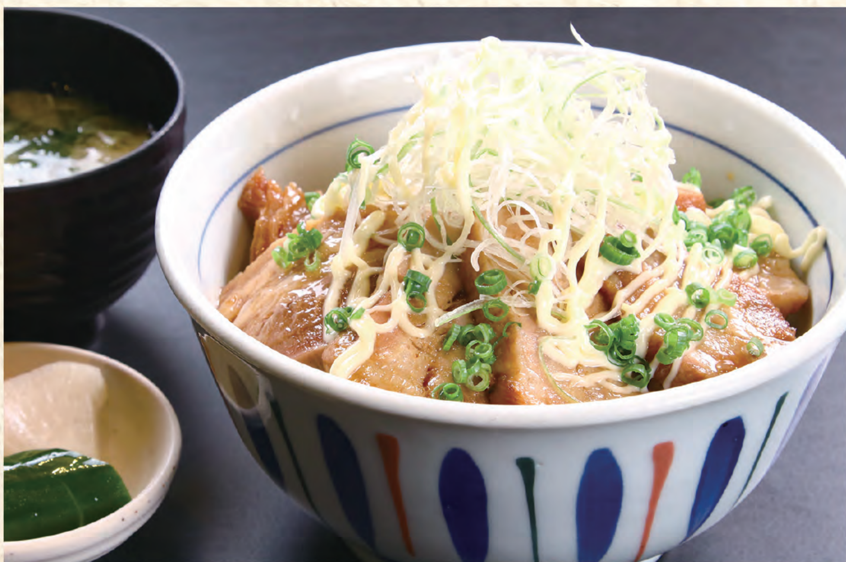
ネギマヨチャーシュー丼 1,300円(税込)