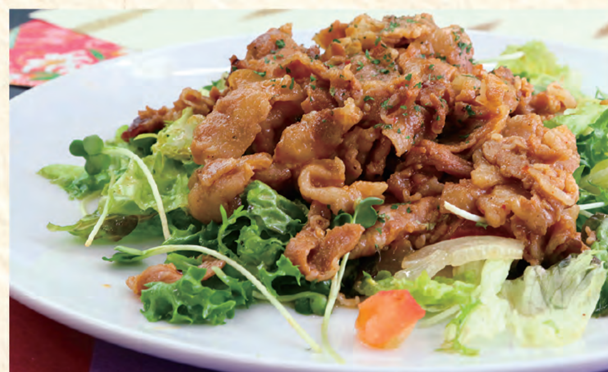
焼肉サラダ 800円(税込)