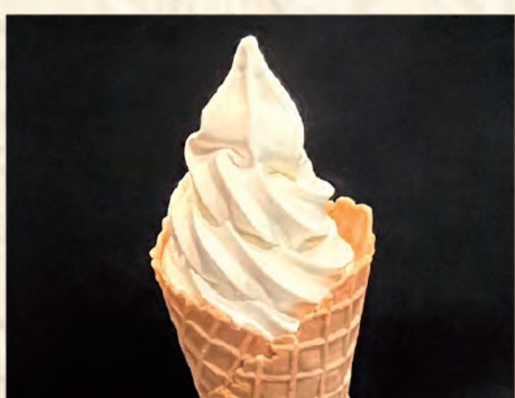
ソフトクリーム 380円(税込)