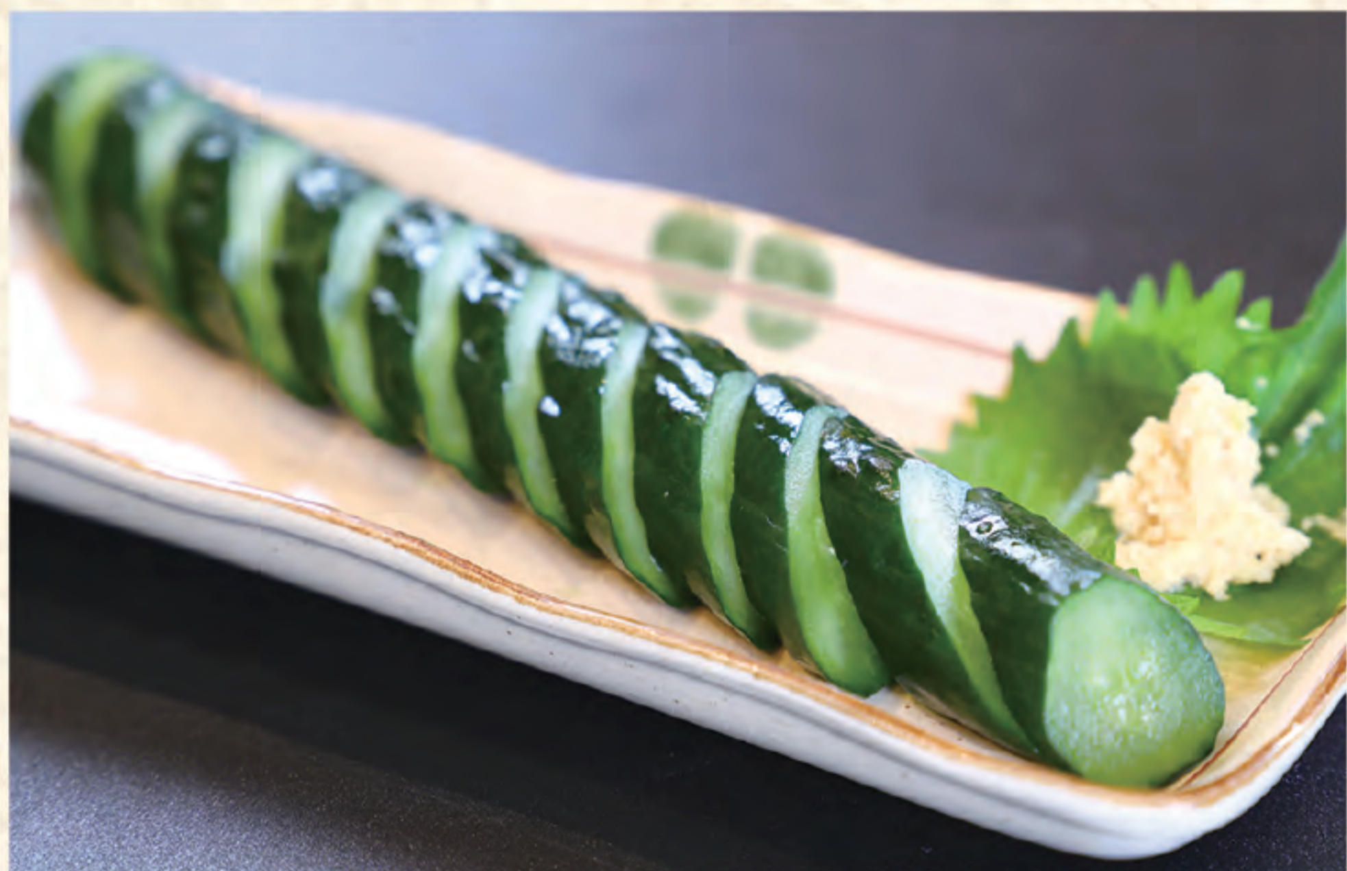
胡瓜一本漬 400円(税込)