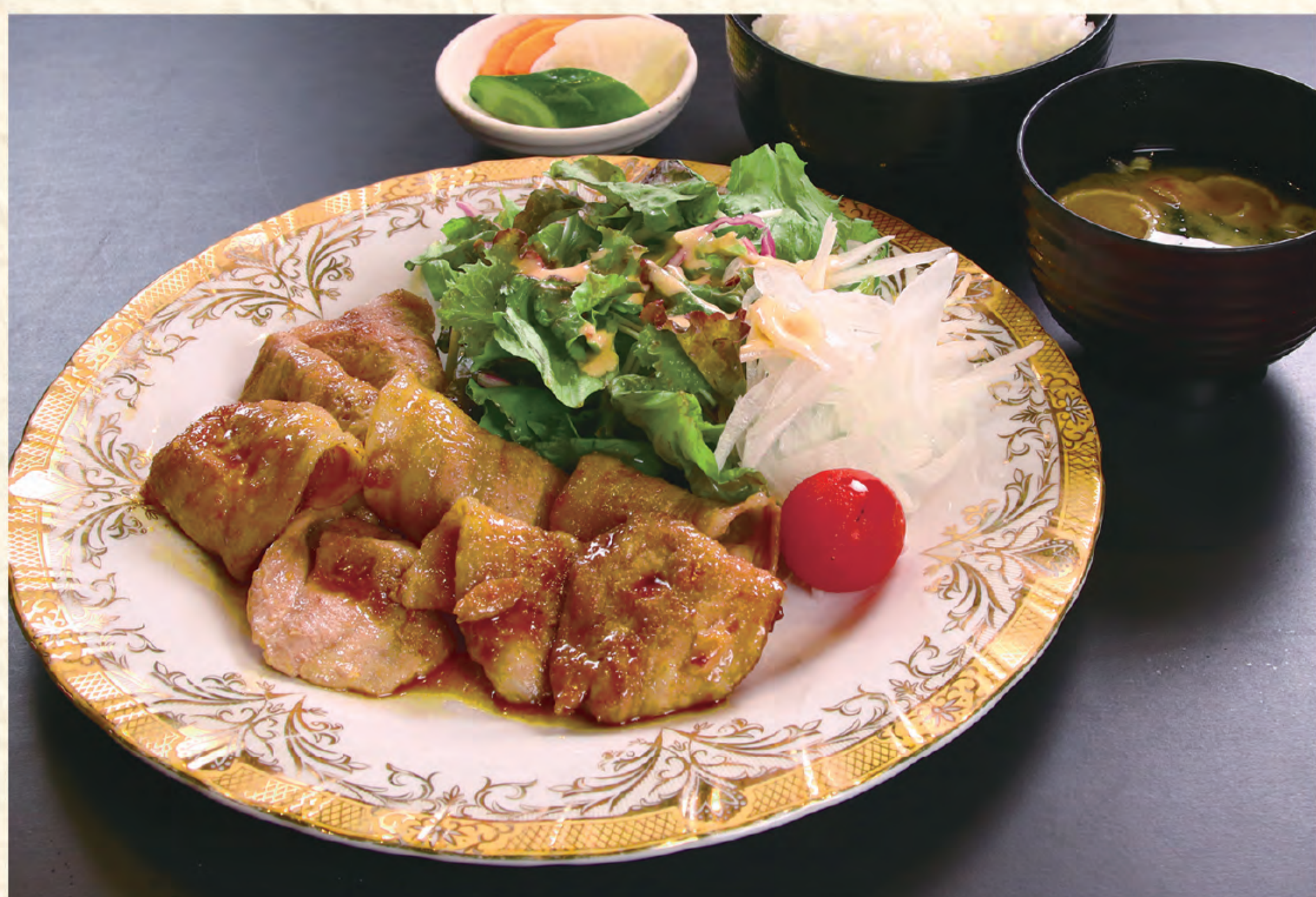
生姜焼き定食 1,300円(税込)