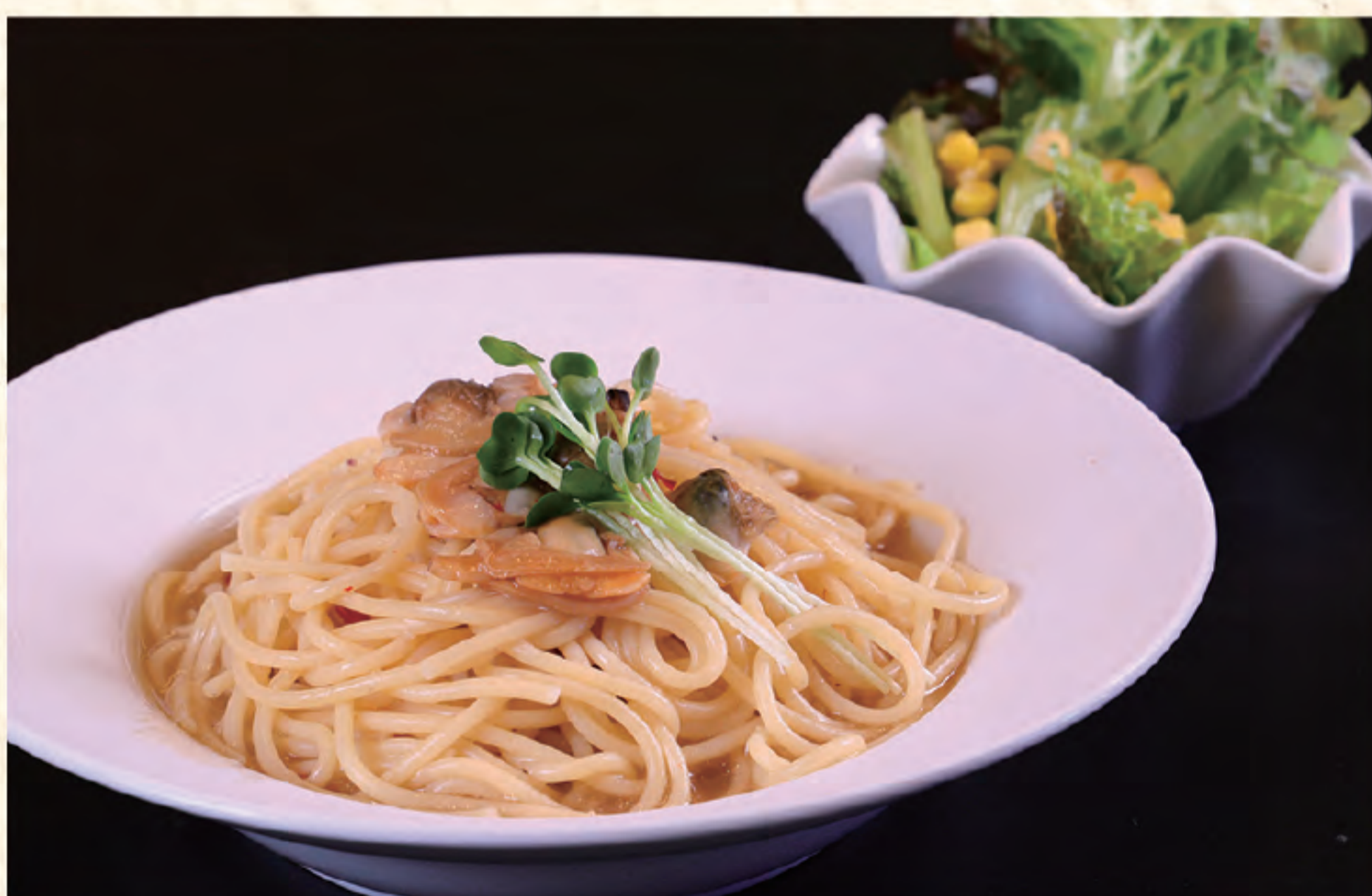
ボンゴレビアッコ 1,000円(税込)