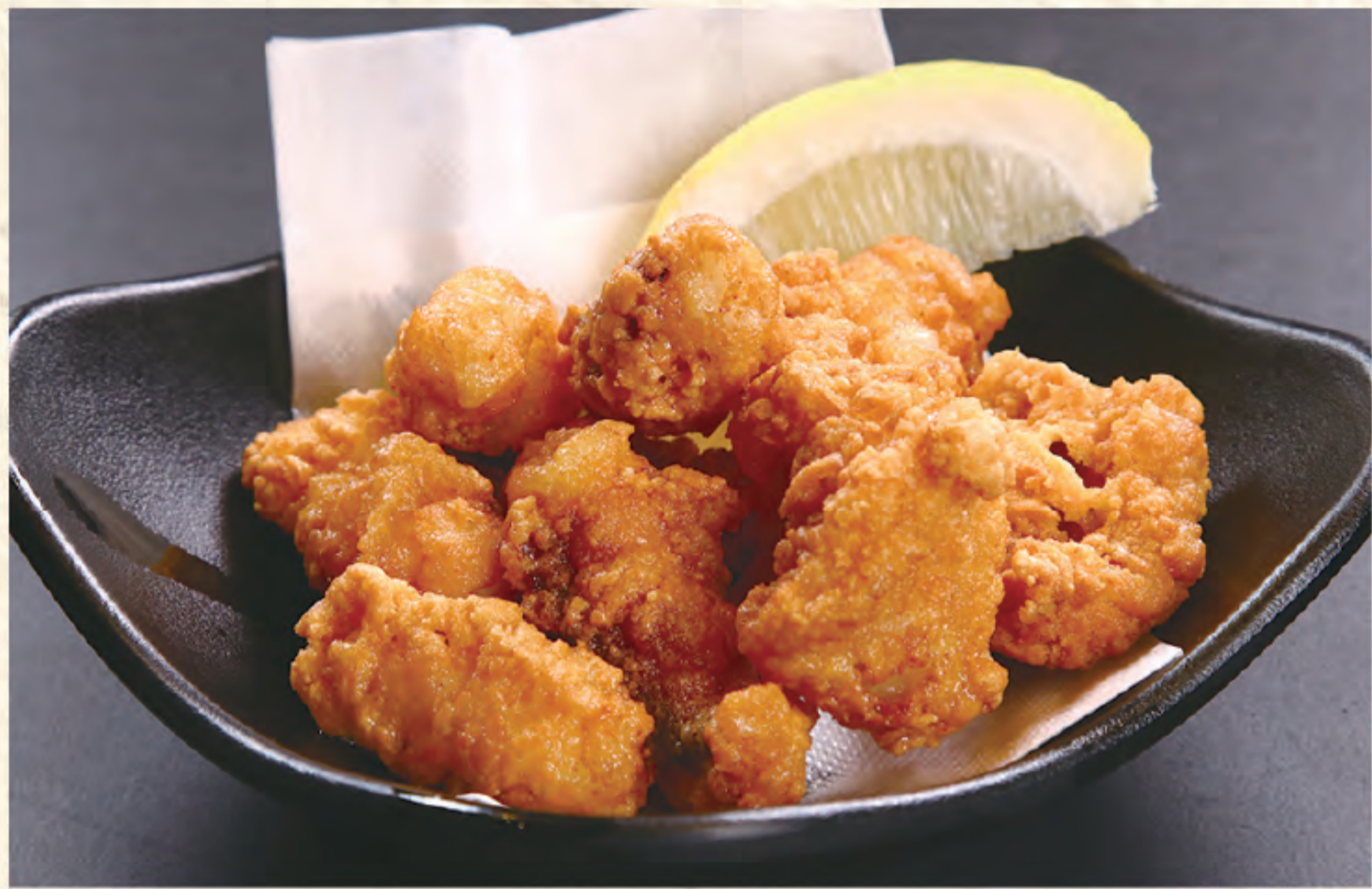
タコの唐揚げ 800円(税込)