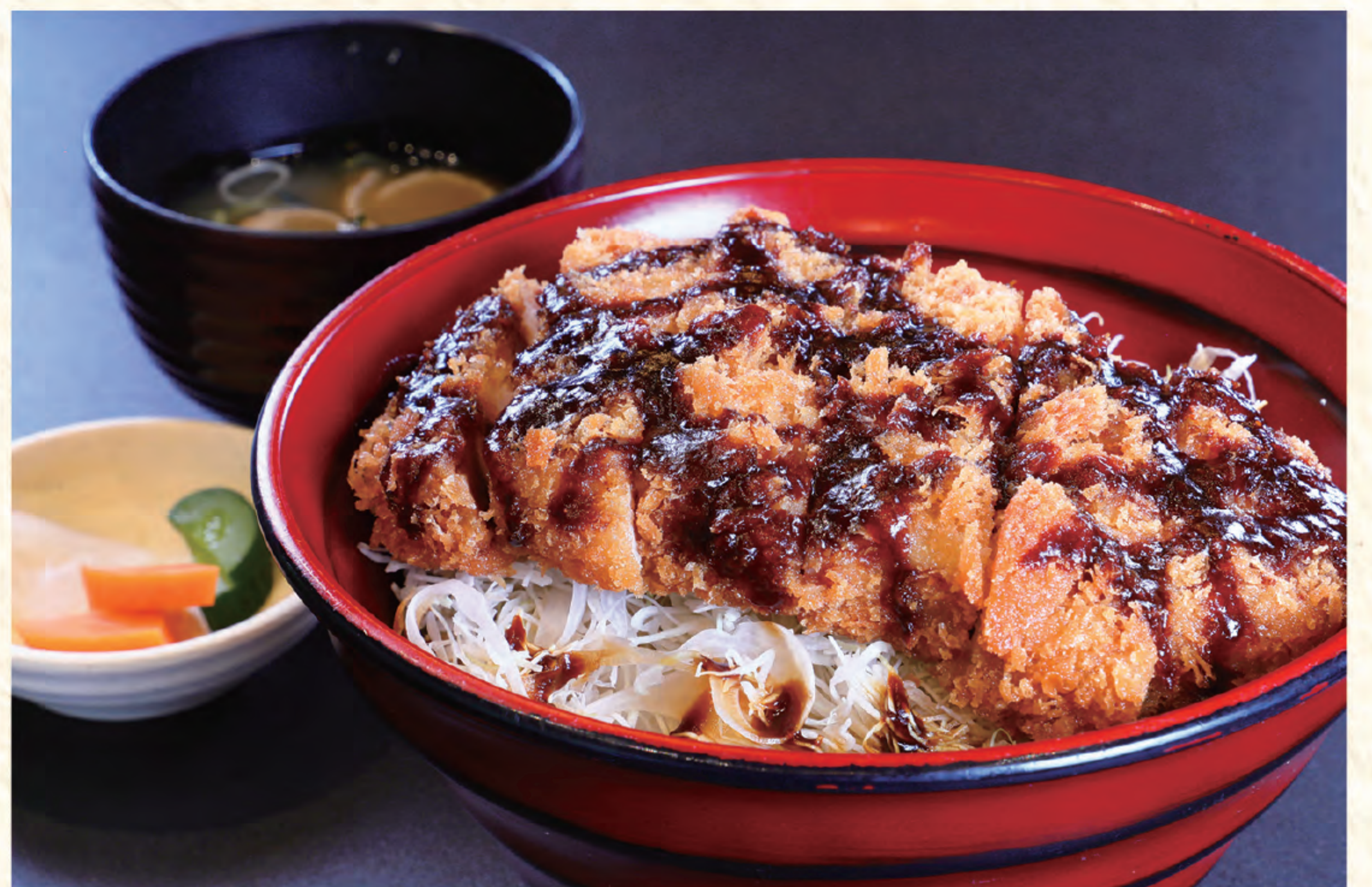
三元豚みそかつ丼 1,300円(税込)