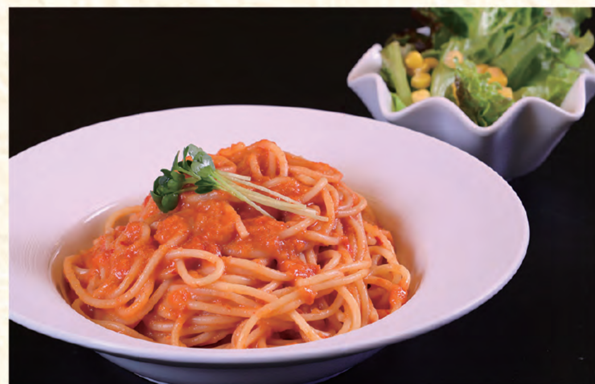
蟹トマトクリーム 1,000円(税込)