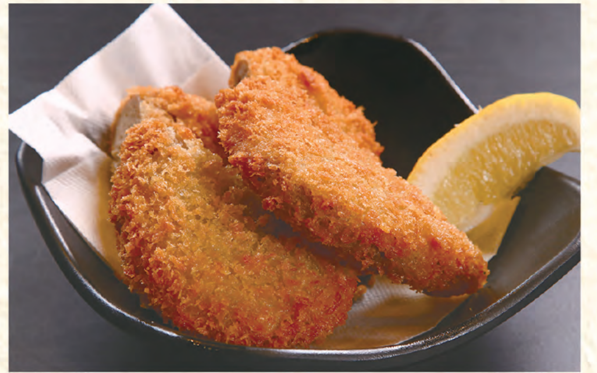
黒はんぺんフライ 500円(税込)