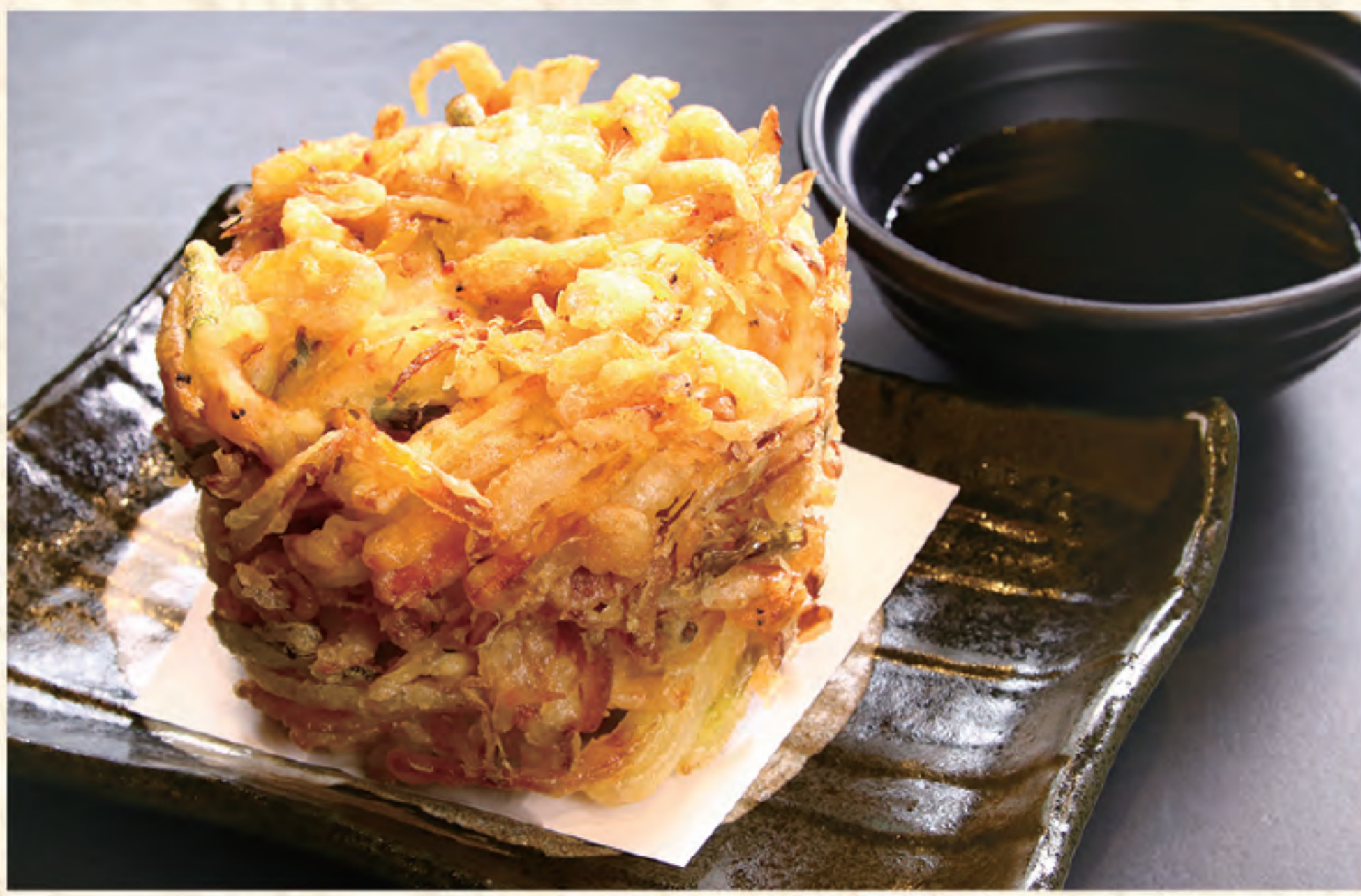
桜エビかき揚げ 600円(税込)