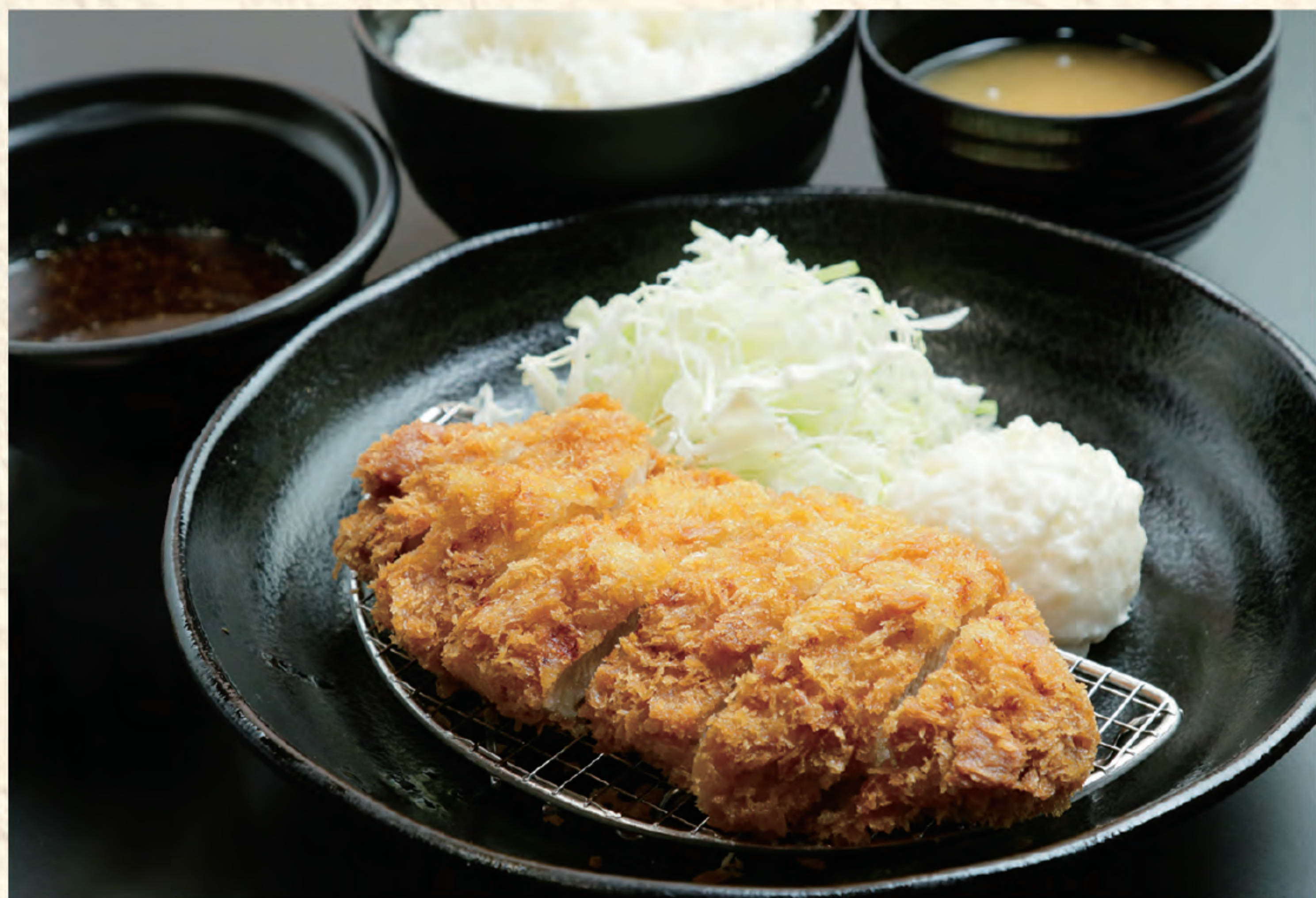
三元豚トンカツ定食 1,300円(税込)