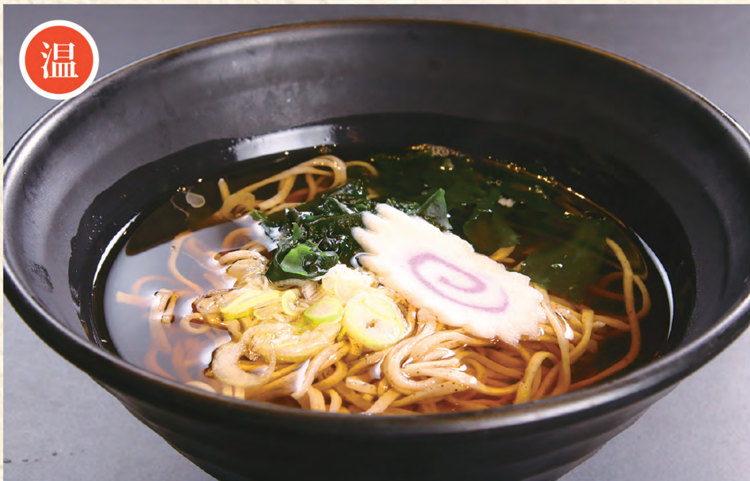
そば 800円 (税込)