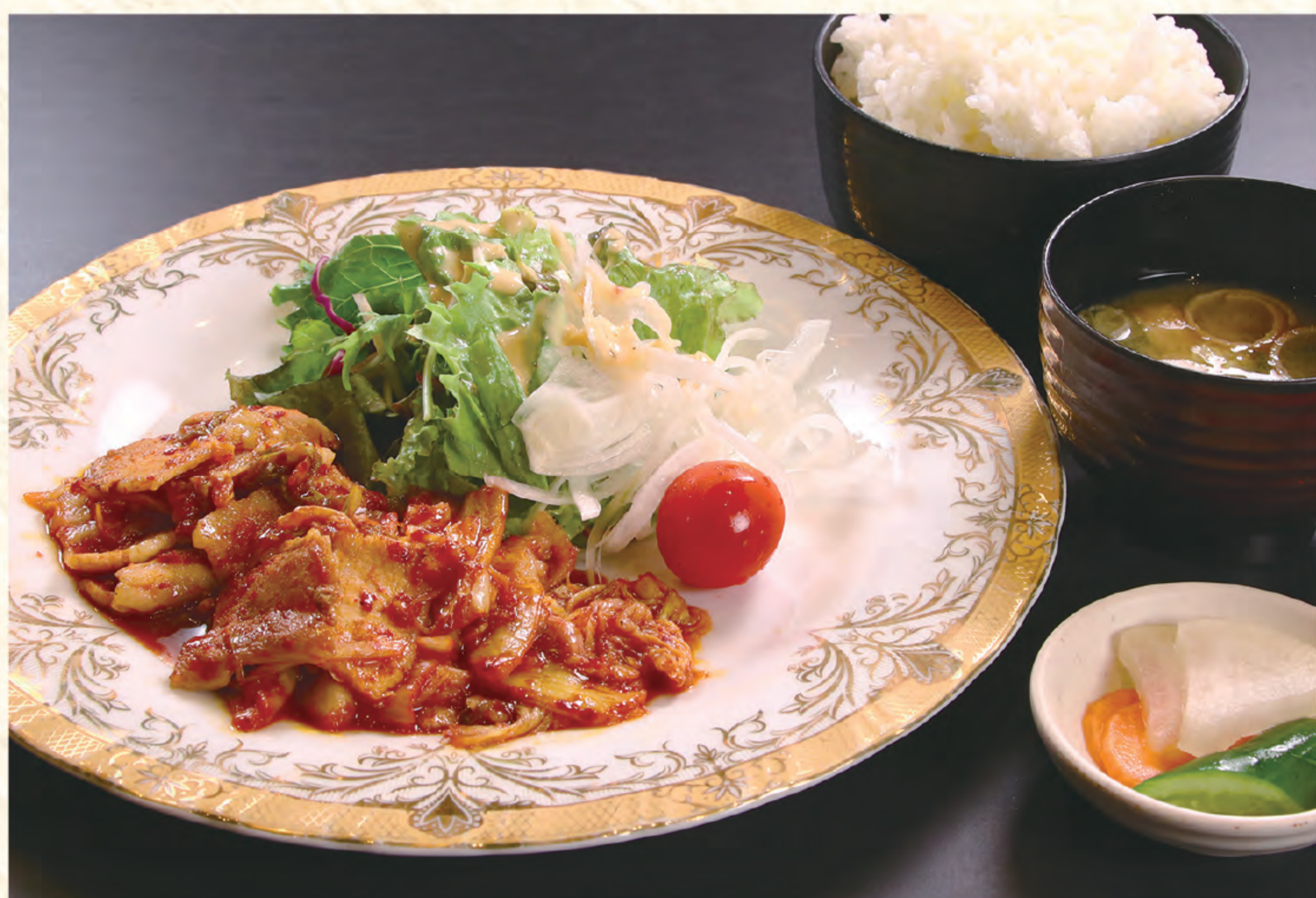
豚キムチ定食 1,300円(税込)