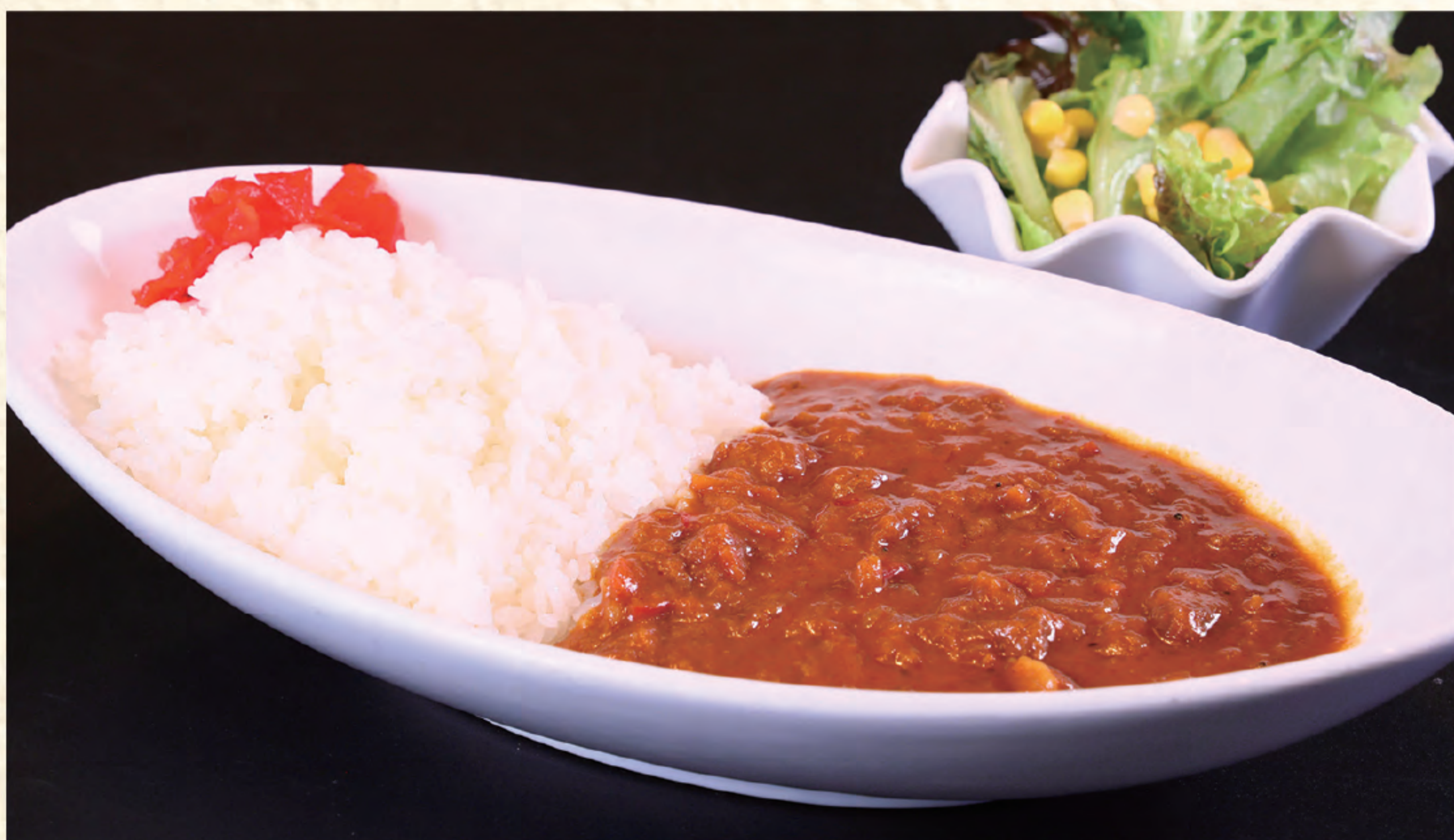
香味トマトカレー 1,000円(税込)