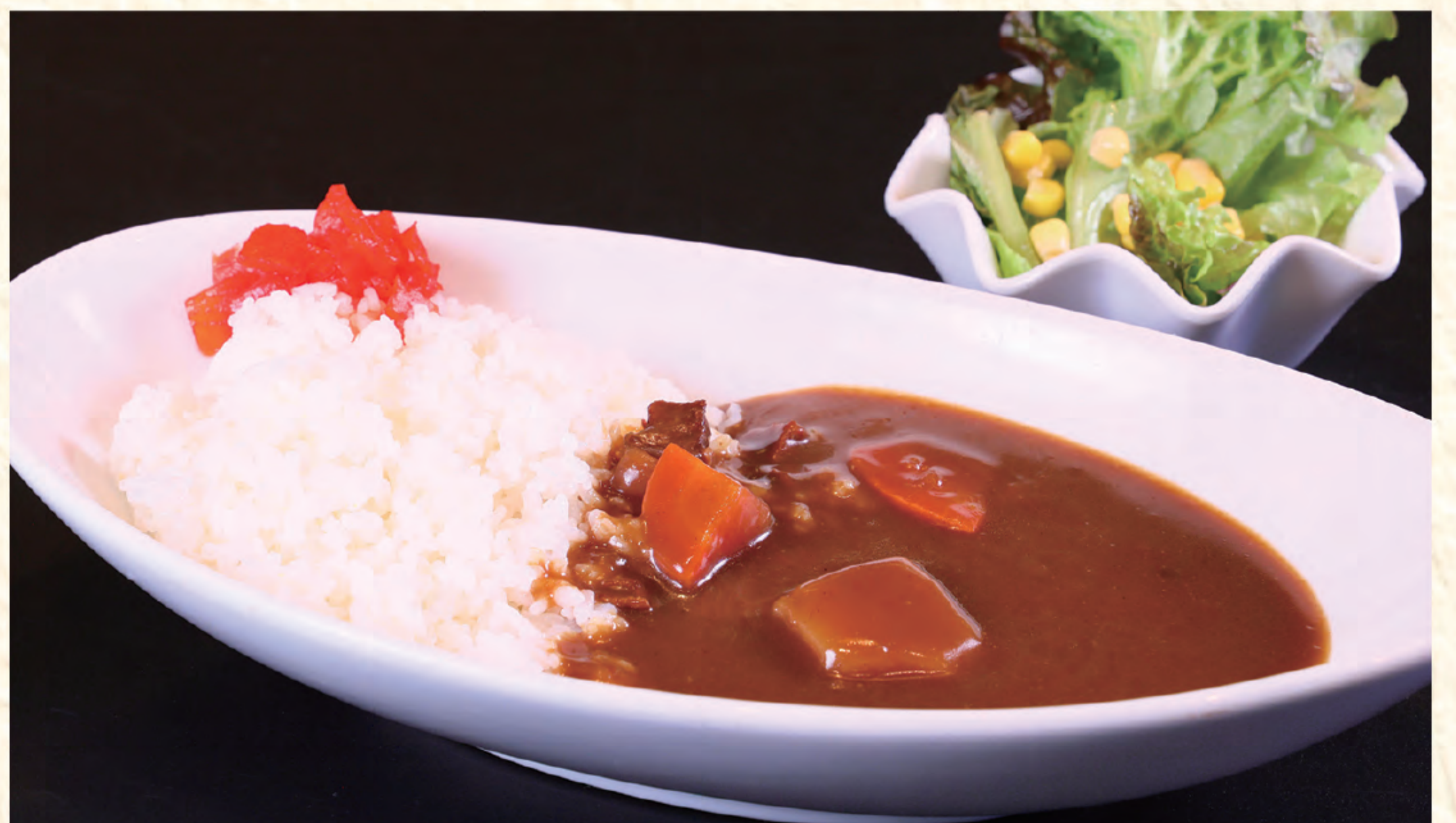
ゴロツと野菜のやさしいカレー 1,000円(税込)