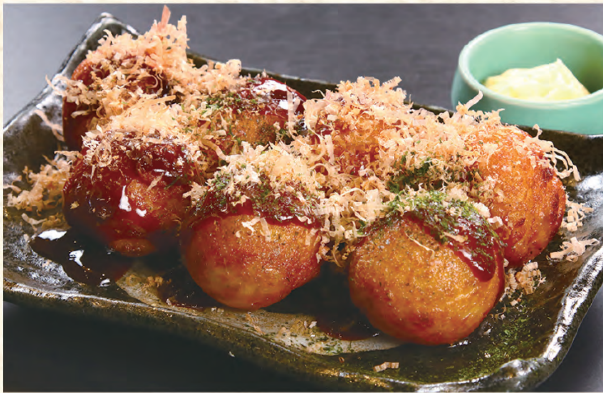
あげたこ焼き 700円(税込)