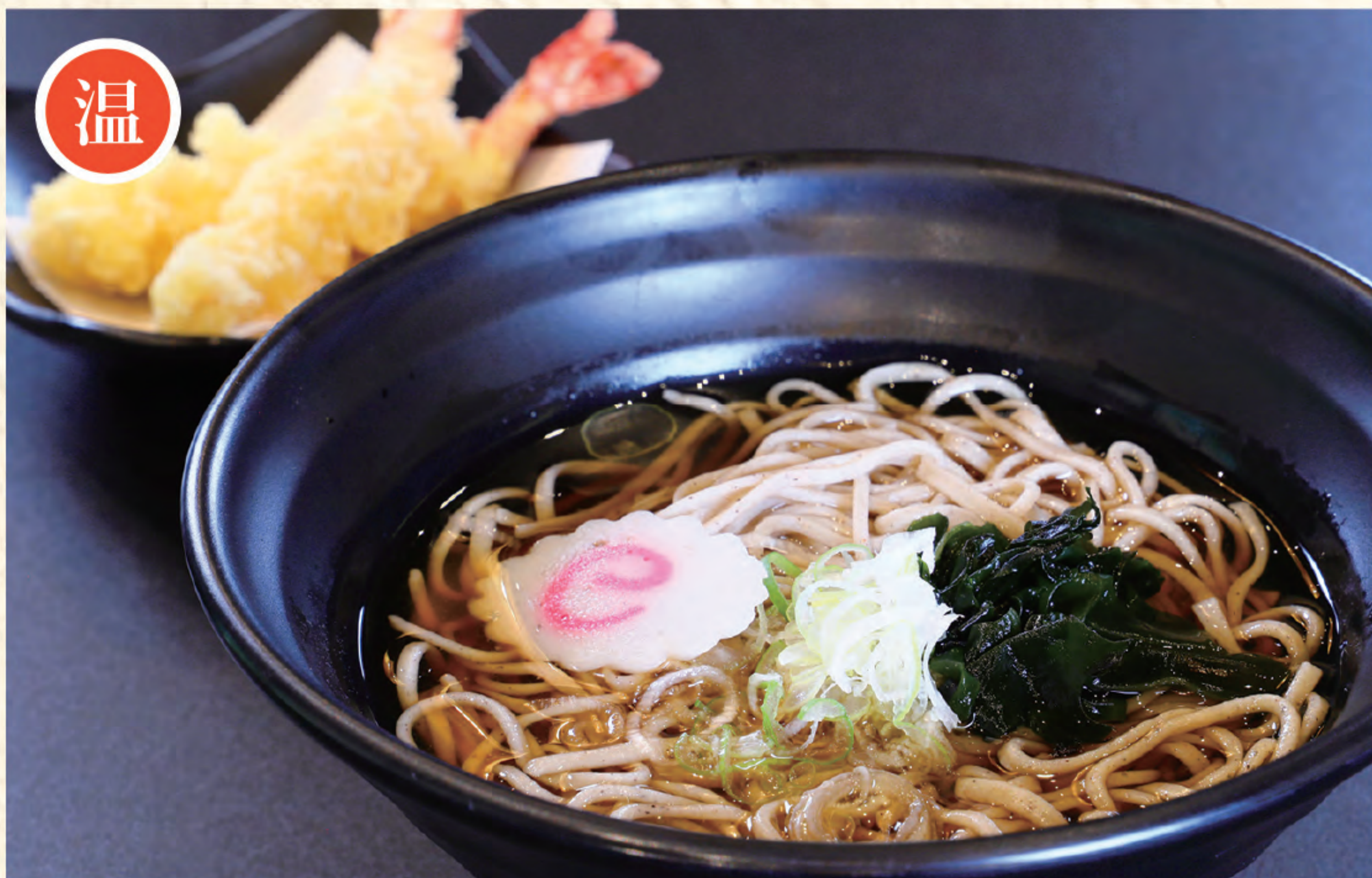
天婦羅そば 1,200円 (税込)