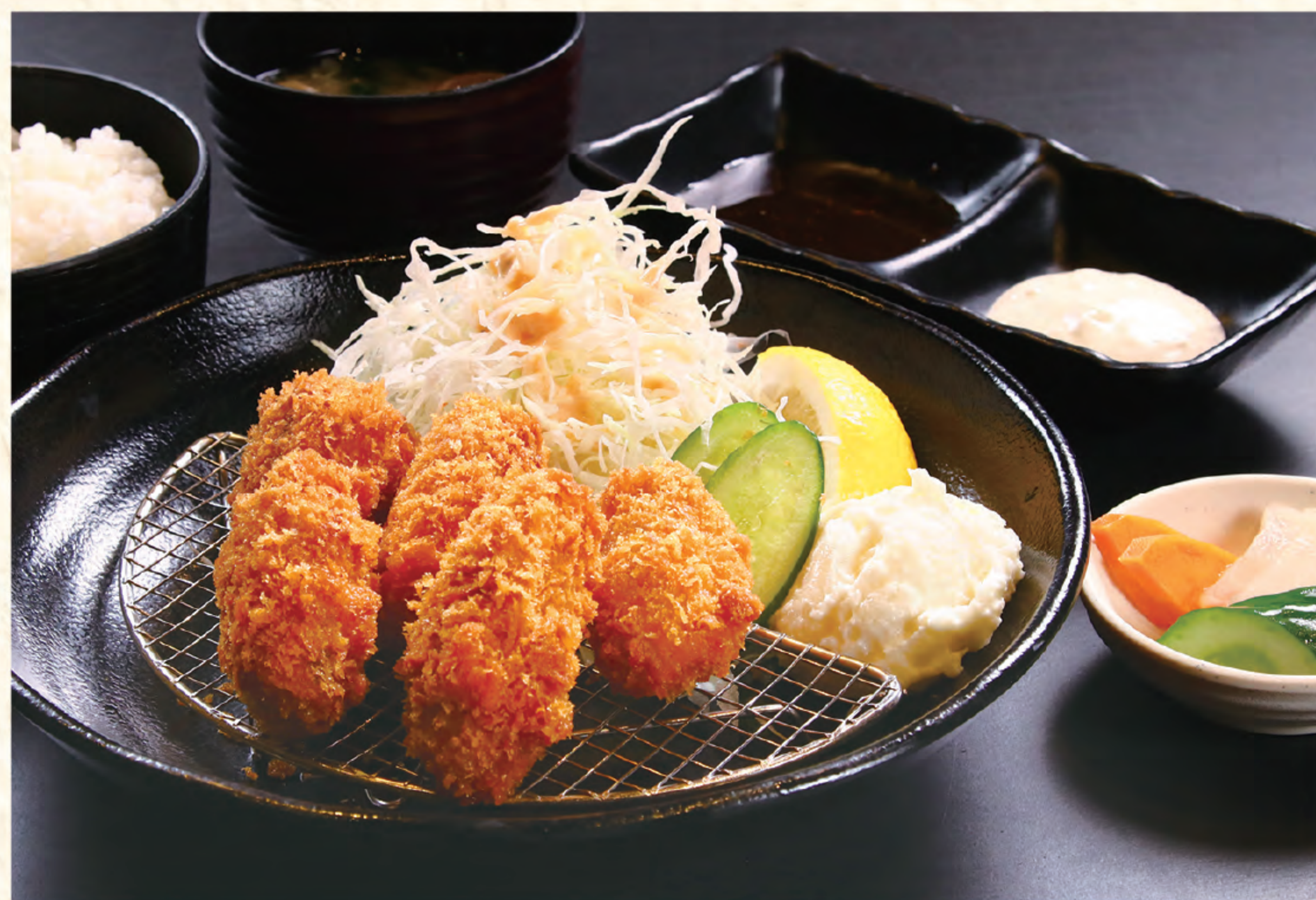
カキフライ定食 1,500円(税込)