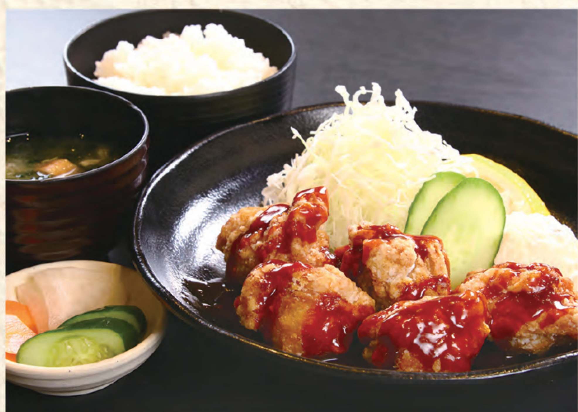
ヤンニョムチキン定食 1,300円(税込)