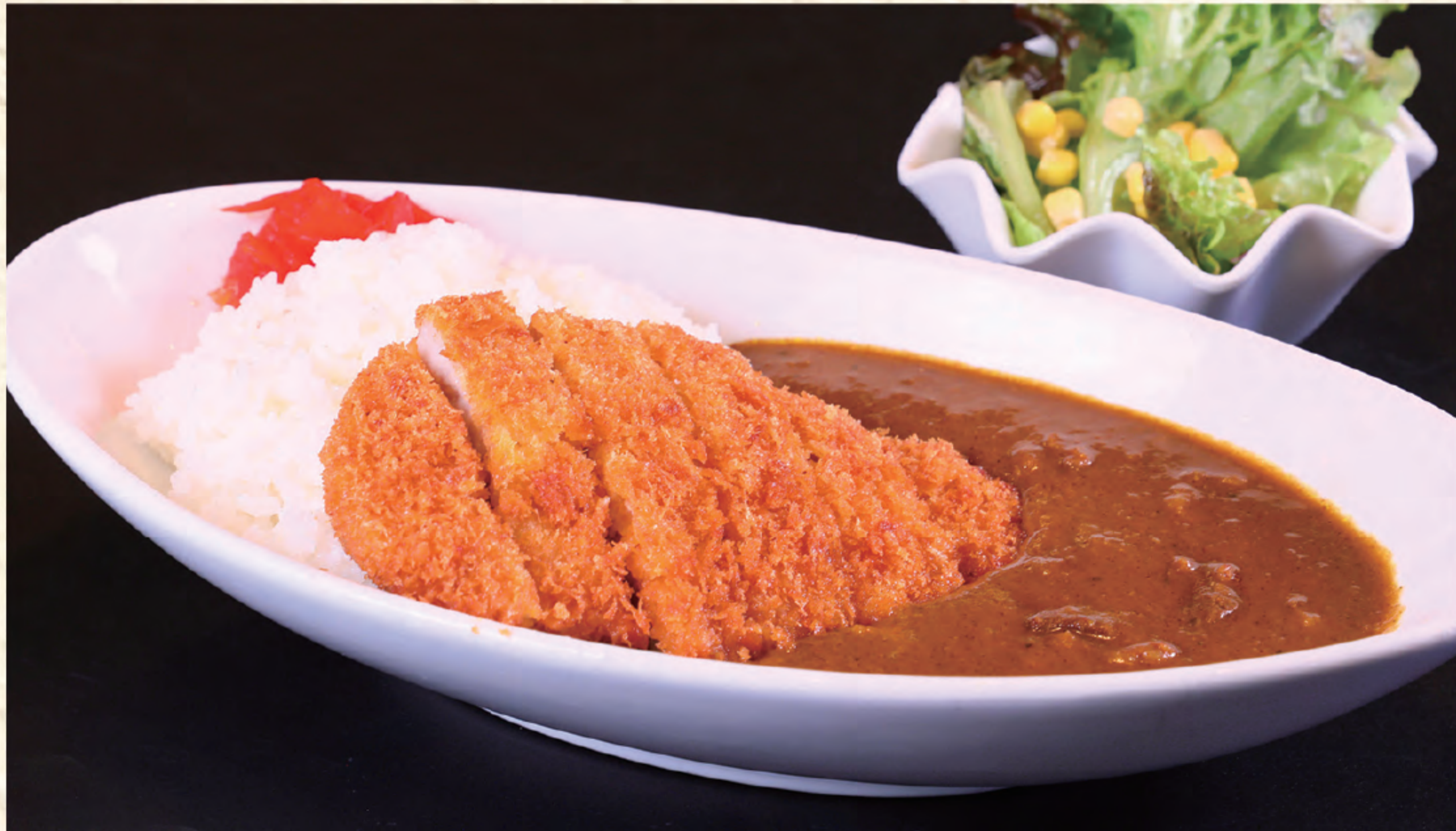
カツカレー 1,300円(税込)