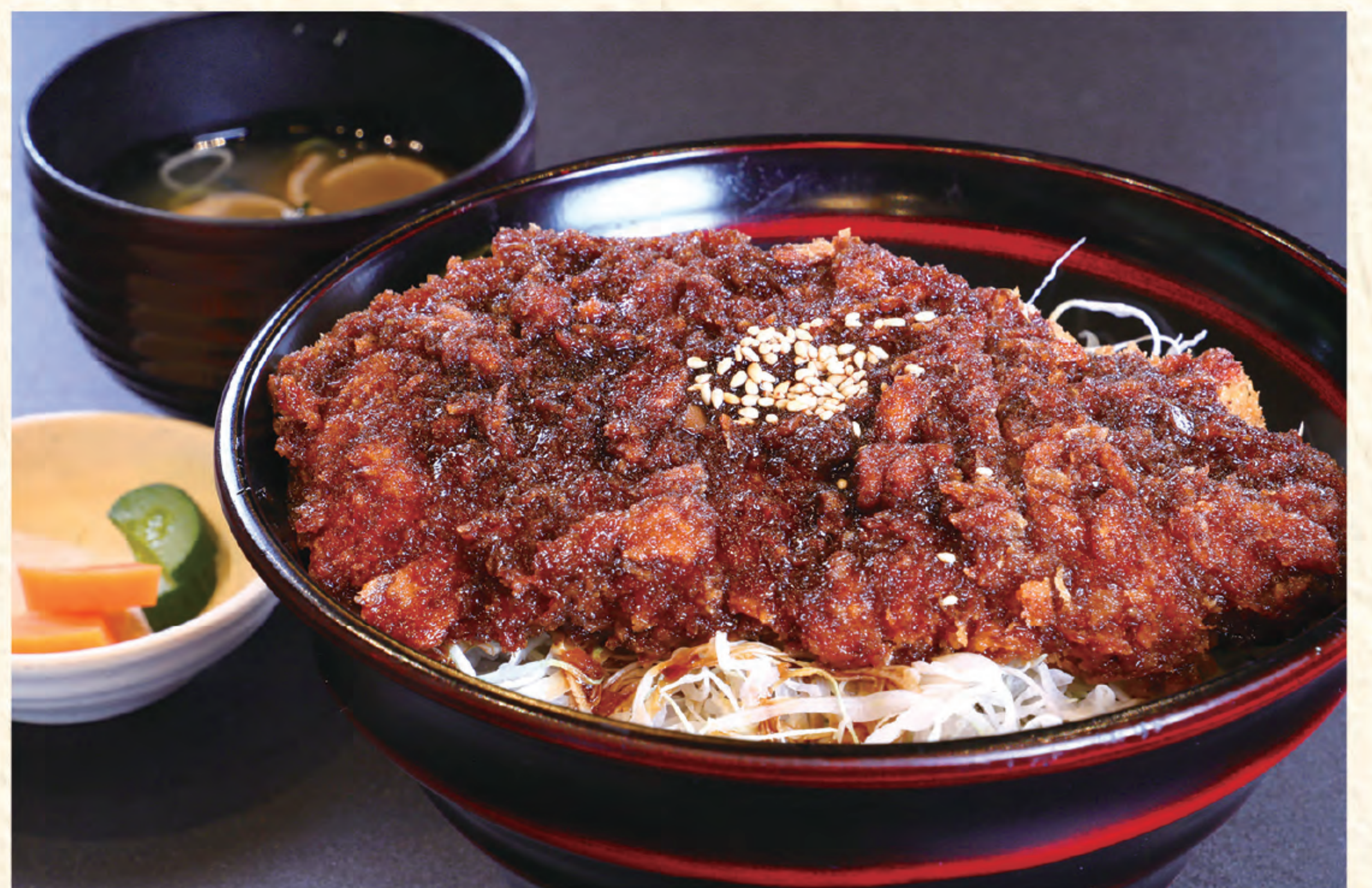
三元豚ソースかつ丼 1,300円(税込)