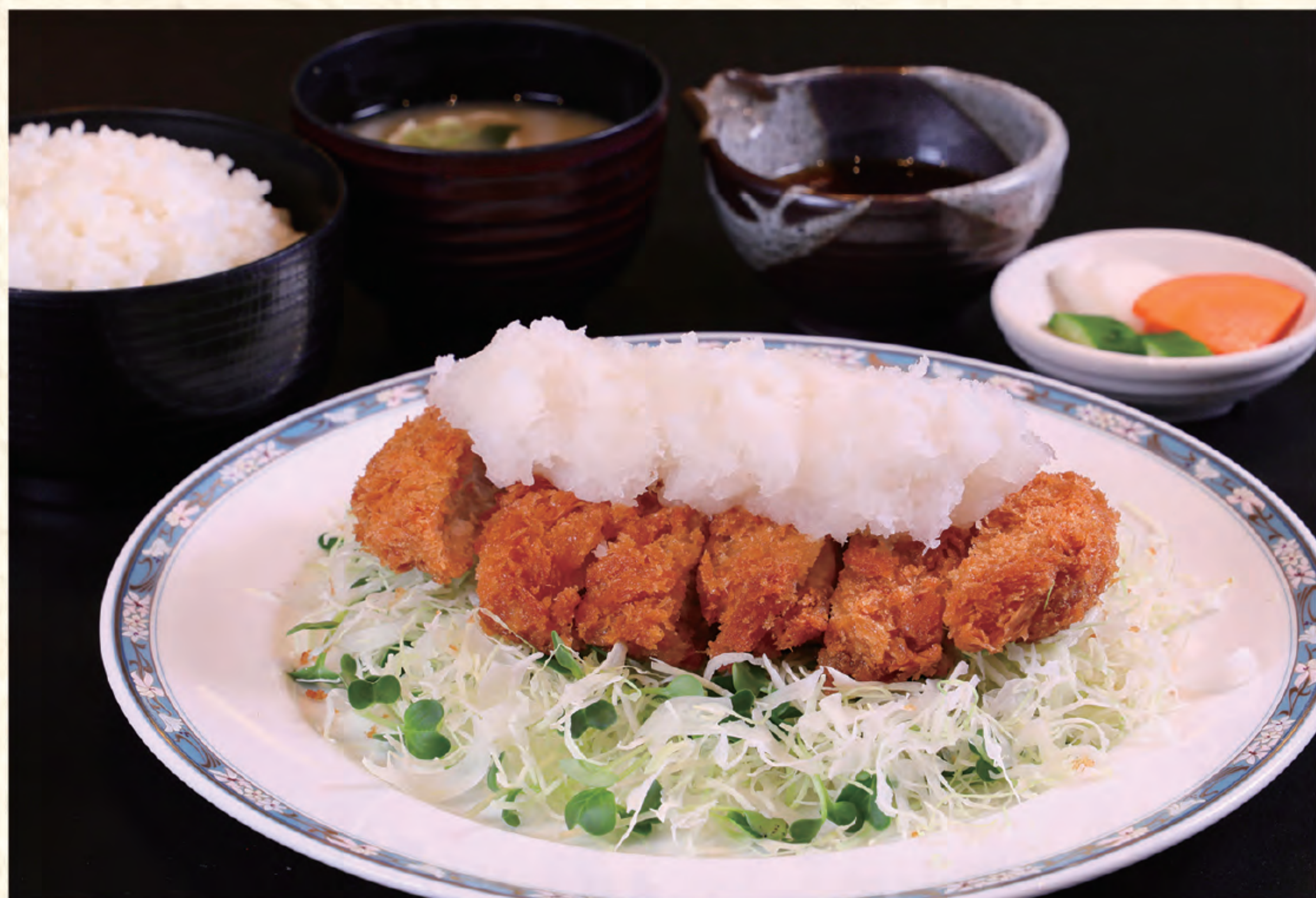
三元豚おろしトンカツ定食 1,500円(税込)