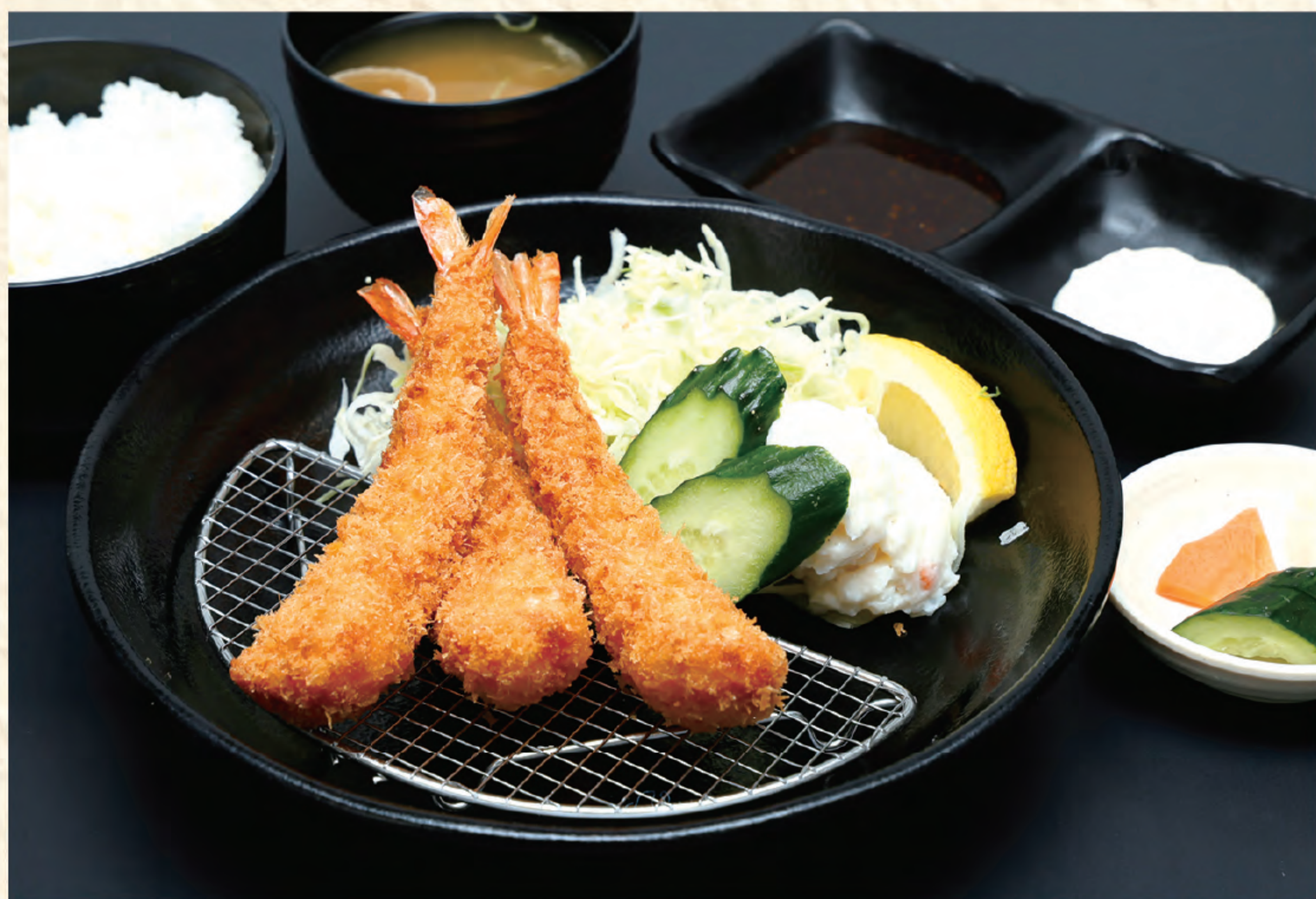
エビフライ定食 1,300円(税込)